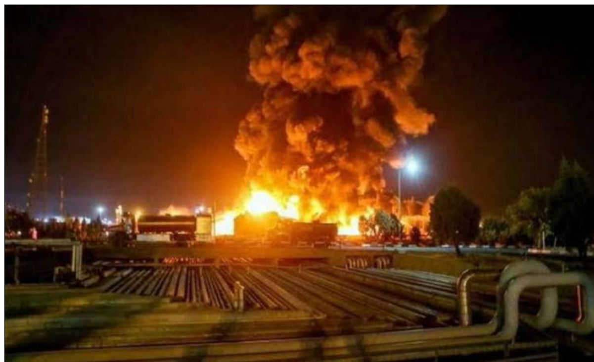
قصف روسي في خاركيف