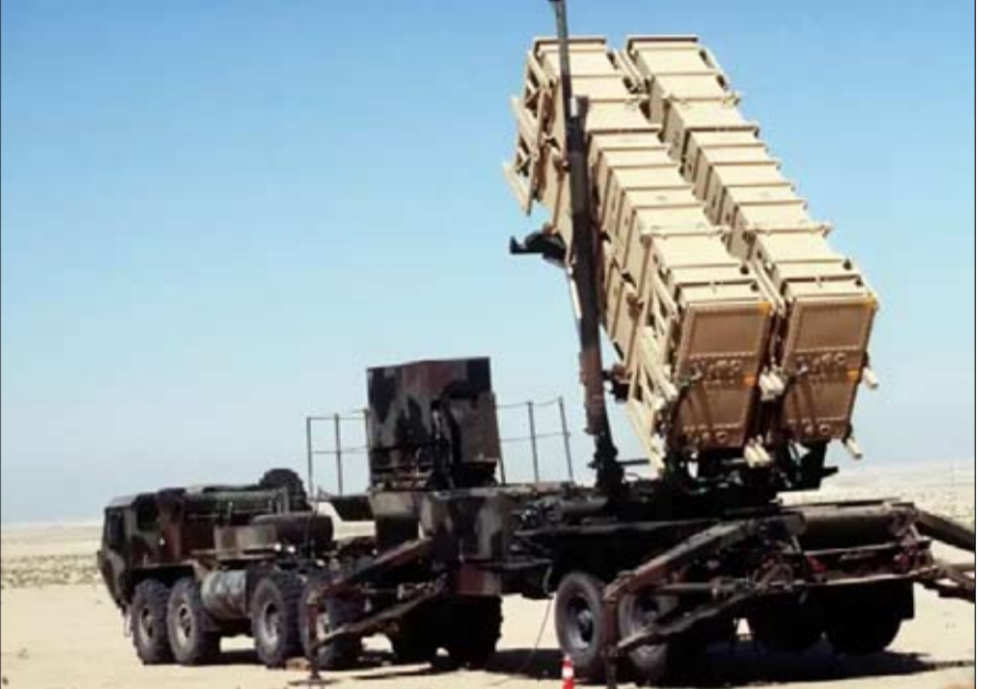
أنظمة باتريوت الأمريكية

تواجه أوكرانيا منذ عدة أسابيع تفجيرات ضخمة لا تستثنى الأراضي الأوكرانية. وفي خاركيف، تحافظ الغارات الجوية على وتيرتها المستمرة، وفي بوتافا بوسط أوكرانيا، فقد 55 مدنياً حياتهم، وأصيب 300 آخرون في 3 سبتمبر-أيلول، وفي وقت سابق من الصيف، في 8 يوليو-تموز، قصفت روسيا مستشفى للأطفال. وفي كل مرة، يتيح نظام الدفاع المضاد للطائرات اعتراض غالبية الصواريخ.