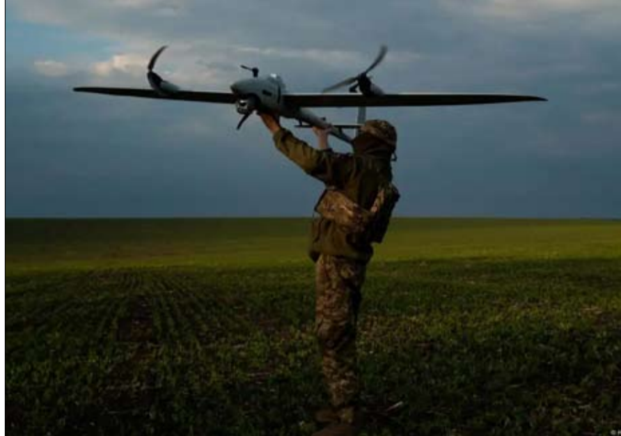
جندي أوكراني يطلق طائرة بدون طيار

رأى وزير الدفاع الصيني دونغ جون أمس أن التفاوض هو الحل الوحيد للنزاعات، مثل حربي غزة وأوكرانيا، خلال إلقائه كلمة أمام منتدى دولي يجمع مسؤولين عسكريين في بكين. وقال دونغ خلال مراسم افتتاح منتدى شيانغشان الأمني إن من أجل حل القضايا الساخنة مثل الأزمة في أوكرانيا والنزاع الإسرائيلي الفلسطيني، فإن تعزيز السلام والتفاوض هو السبيل الوحيد. وأكد ما من منتصر في الحروب والنزاعات. المواجهة لا تفضي إلى أي مكان. كلما كان النزاع خطرا كلما زادت أهمية عدم التخلي عن الحوار والمشاورات. وحدها المصالحة يمكنها أن تضع حدا لأي نزاع. ودعا جميع البلدان إلى تعزيز التنمية السلمية والحوكمة الجامعة. وندد بانتشار كثيف لفاهيم الأمن القومي داعيا إلى أن تفيذ التكنولوجيا الجديدة البشرية بأكملها على نحو أفضل، في إشارة محتملة إلى جهود الولايات المتحدة لمنع وصول بكين إلى التكنولوجيا المتطورة. ويعد منتدى شيانغشان الذي أنشئ العام 2006 بمثابة رد بكين على منتدى شانغهاي-لا" الدفاعي السنوي في سنغافورة الذي تشارك فيه بكين أيضا. ويستضيف المنتدى الصيني أكثر من 500 ممثل من أكثر من 90 دولة ومنظمة على مدى ثلاثة أيام، بحسب وسائل الإعلام الرسمية.