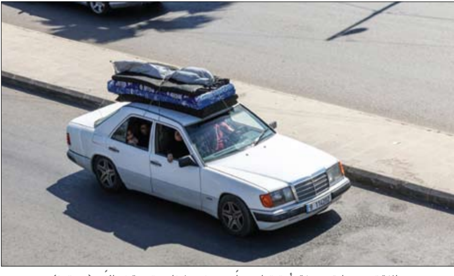
عائلة تقود سيارة محملة بأمتعتها، هربا من جنوب لبنان متجهة شمالا.

حيث سمو الشخة فاطمة بنت مبارك، أم الإمارات، رئيسة الاتحاد النسائي العام، رئيسة المجلس الأعلى للأمومة والطفولة، الرئيسة الأعلى مؤسسة التنمية الأسرية، صمود وشجاعة وإصرار ملايين اللاجئين حول العالم، ولا سيما النساء اللواتي يواصلن التغلب على تحديات استثنائية، بينما يقمن برعاية أسرهن ويسهمن في خدمة مجتمعاتهن؛ إذ تواجه النساء اللاجئات ظروفا قاسية تفرضها طبيعة أماكن اللجوء، سواء كانت اجتماعية أو اقتصادية أو بيئية. وقالت سموها في كلمة لها بمناسبة اليوم العالمي للاجئين الذي يصادف 20 يونيو من كل عام، إن هناك الكثير من الحالات التي لا تتوفر فيها للنساء أبسط مقومات الحياة، ما يتطلب توفير الدعم والمساندة لهن ليستطعن إحدات تحول حقيقي في حياتهن و حياة عائلاتهن والاستقرار والعيش بكرامة. (التفاصيل ص3) عمدة جنرال سانتوس: المساعدات الإماراتية منحت الأسر المنصرة أملا في تجاوز آثار زلزال الفلبين جنرال سانتوس - وام: أضادت سعادة لورلي باكيوا، عمدة مدينة جنرال سانتوس، بالمساعدات الإنسانية العاجلة التي قدمتها دولة الإمارات للمتضررين من الزلزال في جنوب الفلبين، مؤكدة أن هذا الدعم يعكس القيم الإنسانية الراسخة للإمارات، ويسهم في تخفيف معاناة الأسر والأطفال وتوفير الاحتياجات الأساسية للمتضررين. جاء ذلك خلال استقبالها لفرق الاستجابة الإماراتية التي يتواجد في الفلبين لتابعة ودعم المتضررين من الزلزال الذي وقع جنوب البلاد. (التفاصيل ص2)