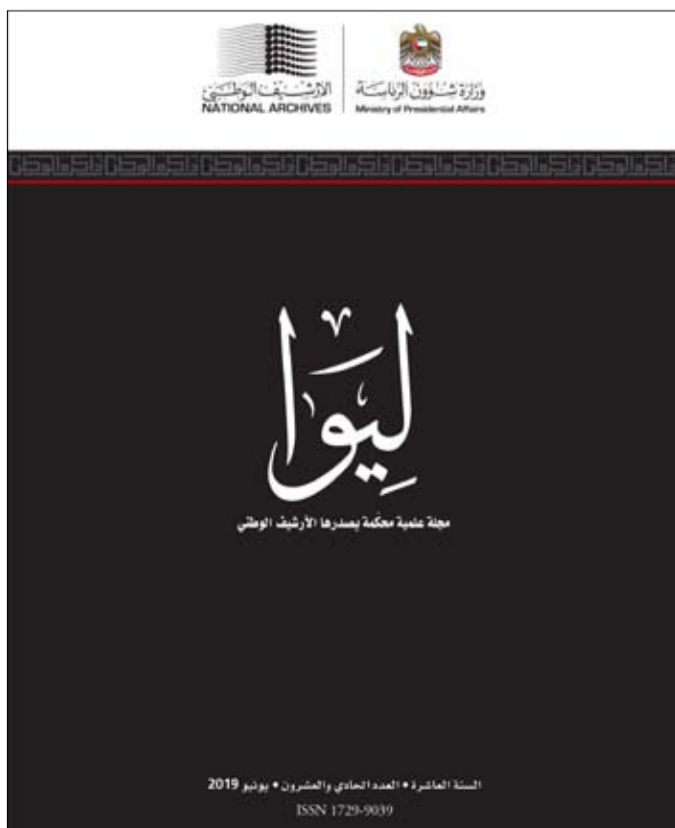
العدد 21 من مجلة ليوا العدد 21 من مجلة ليوا ISSN 1729-9039