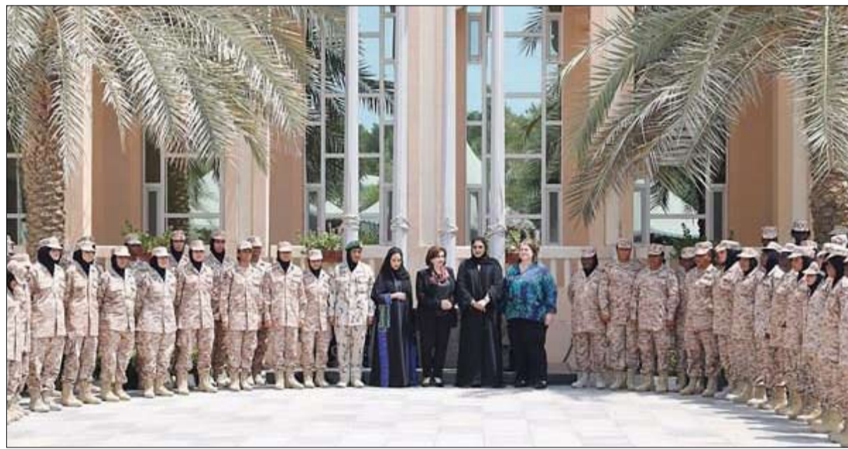
دولة الإمارات، إلى تقديم تجربتها الرائدة في مجال تمكين المرأة كمنهج يحتذى به عالمياً من خلال الشراكة الاستراتيجية مع هيئة الأمم المتحدة

وتستهدف الشراكة الموقعة تعزيز دور النساء والفتيات في القيادة وصنع القرار وتمكينهن اقتصادياً وتوسيع مشاركتهن في الحياة العامة، فضلاً عن تعزيز حقوق المرأة في مجالات السلام والأمن وتحقيق التنمية المستدامة من خلال العمل المناخي.