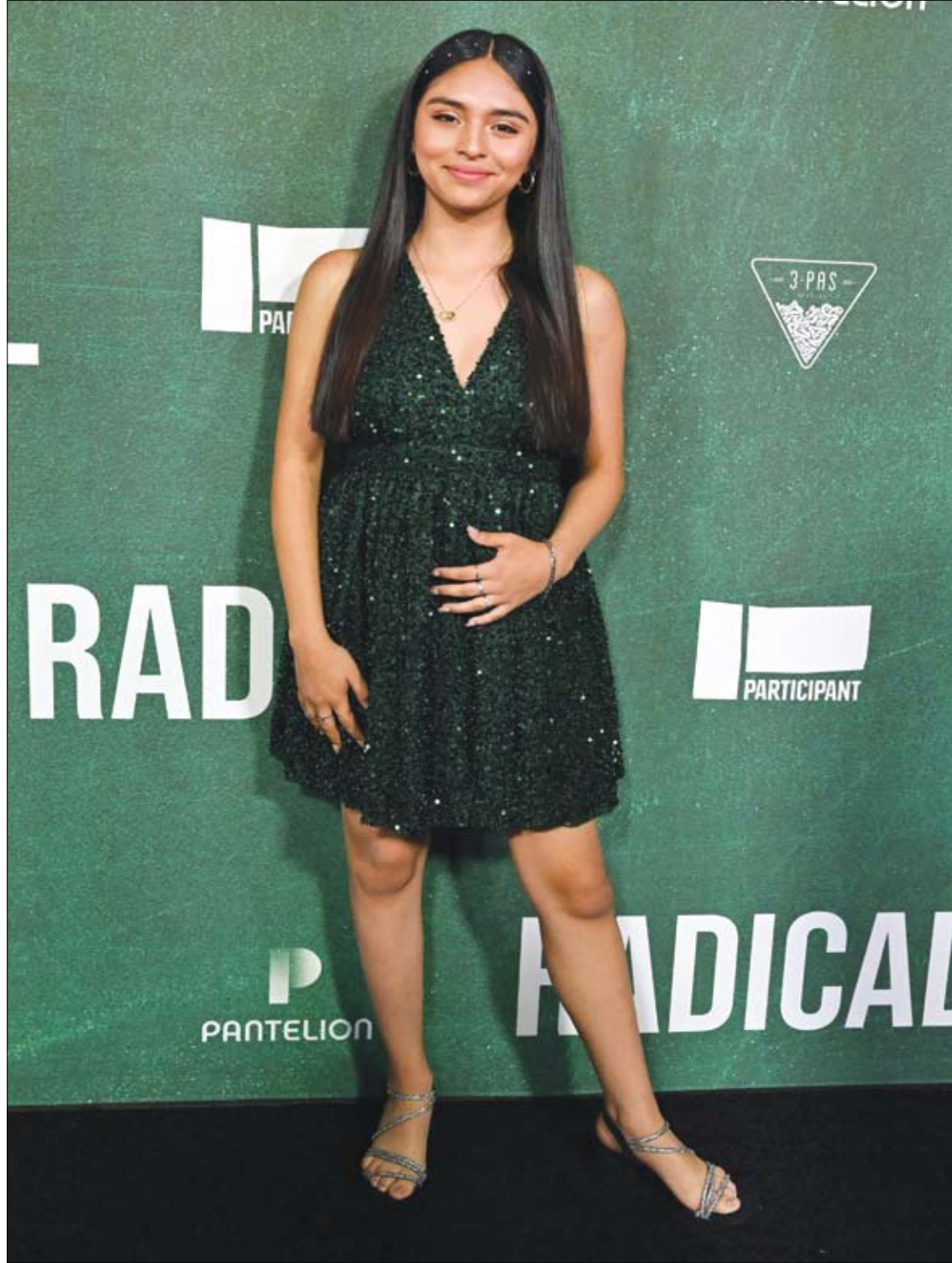
المثلة جينييفر تريجو لدى حضورها العرض الأول لفيلم Radical في لوس أنجلوس.

وتشير الدكتورة جيرجانا ستويانوفا أخصائية طب وجراحة العيون إلى أن أسباب هذا المرض هي: 1 - العمر- إذا كان خطر الإصابة بالمرض 2 بالمئة في عمر 50 عاماً ففي عمر 75 عاماً تصبح هذه النسبة 50 بالمئة. 2 - الوراثة - لقد ثبت أن أكثر من 50 جينا يمكن أن تؤدي إلى تطور العيوب المسببة للضمور البقعي المرتبط بالعمى. 3 - التدخين - تتصح الطبيبة بالإقلاع نهائياً عن التدخين من أجل تخفيض خطر الإصابة بهذا المرض. 4 - الوزن الزائد - لمنع تطور المرض يجب على المريض تناول كميات أقل من الأطعمة الدهنية، وممارسة الرياضة، وعدم التعرض لأشعة الشمس المباشرة. ووفقاً للخبراء، يتطور المرض في المراحل الأولى من دون أعراض، حيث يلاحظ الشخص انخفاض طفيف في حدة الرؤية لا يمكن تصحيحه بالنظارات. كما قد يشعر بعدم الراحة أثناء القراءة، حيث يصبح من الصعب عليه التعرف على النص في الظلام، ويحتاج إلى مصدر ضوء إضافي. ولكن عندما يدخل المرض في المرحلة الثانية يفقد الشخص بسرعة الرؤية المركزية وأحد الأعراض المميزة هو تشوه الخطوط المستقيمة. ووفقاً للطبيبة، إذا لم يحصل المصاب على المساعدة الطبية اللازمة في الوقت المناسب، فقد يتطور المرض إلى مرحلة الضمور وتصبح التغيرات في الرؤية المركزية عملياً غير قابلة للإصلاح.