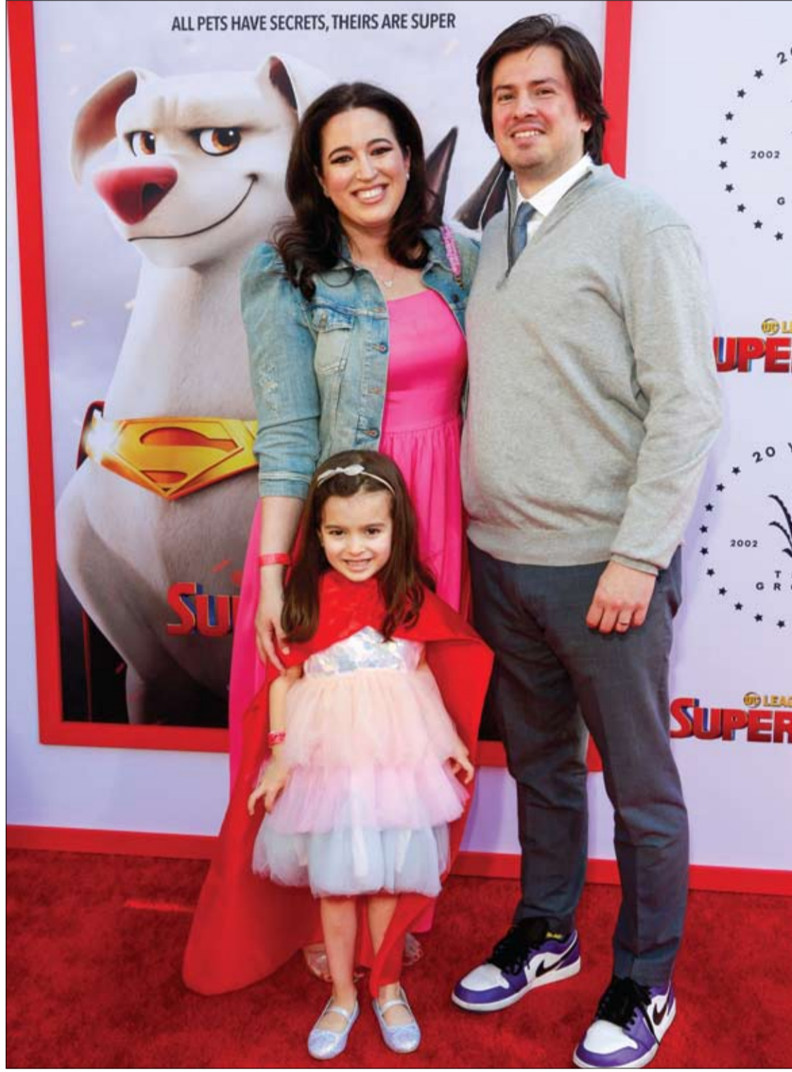
الكاتب جون ويتينجتون وعائلته خلال حضورهم العرض الأول لفيلم DC League Of Super Pets في لوس أنجلوس، كاليفورنيا.