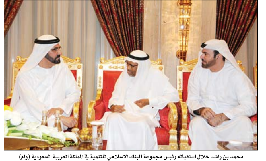
محمد بن راشد خلال استقباله رئيس مجموعة البنك الإسلامي للتنمية في المملكة العربية السعودية

حمدان بن زايد يتفقد مهرجان ليوا للرطب 2013 المنطقة الغربية - الفجر: أشاد سمو الشيخ حمدان بن زايد آل نهيان ممثل القوات المسلحة بدعم المزارعين والاعتناء بالنخلة باعتبارها ثروة وطنية. وأكد سمو الشيخ حمدان بن زايد آل نهيان أن ما حققه المهرجان من نجاح لافت يؤكد صحة النهج الذي سار عليه الغفور له الراحل الشيخ زايد بن سلطان آل نهيان طيب الله ثراه. (التفاصيل ص 2)