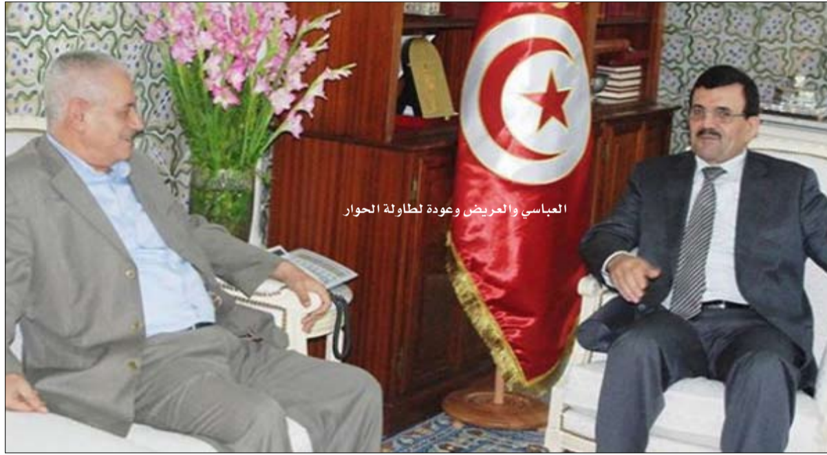
العباسي والعريض وعودة لطاولة الحوار