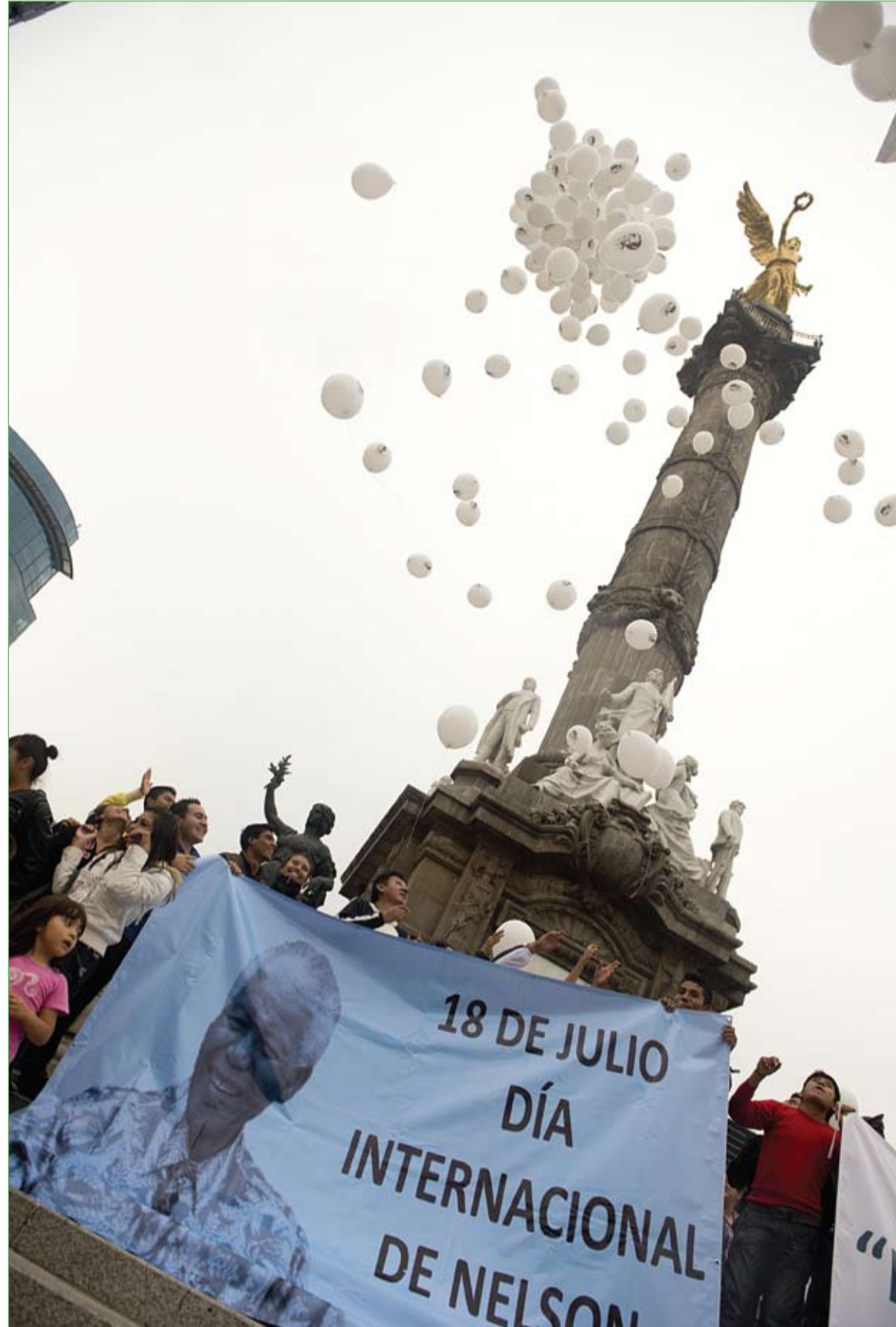
أعضاء جمعية الضمير والكرامة يحملون صورة ضخمة مانديلا ويطلقون بالونات تحمل صورة احتفالاً بعيد ميلاده الخامس والتسعين في مدينة مكسيكو. (ا ف ب)

قالت أكبر أم في العالم الهندية راجو ديفي لوهان، إنها تستمد القوة من ابنتها نافين التي أصبحت في الخامسة من العمر الآن، مشيرة إلى أنها تسعى للبقاء على قيد الحياة إلى حين زواج صغيرتها. وذكرت صحيفة (الصن) البريطانية أن لوهان (74 عاماً) التي شارفت على الموت بسبب تعقيدات حملها اثر الخضوع لتلقيح اصطناعي، وانجابها الطفلة في العام 2008 وهي في الـ70 من العمر، تخطل كل المصاعب والأمراض مستمدة القوة من ابنتها التي تسعى جاهدة لتربيتها والبقاء معها إلى حين زواجها. وقالت لوهان إن نافين هي هبة من الله، ولا يمكنني أن أموت إلى أن أزوجه وأضفت سألزوجها عندما تصبح في الـ15 من العمر، وحتى ذلك الحين لا يمكنني بكل بساطة أن أموت وشذت على أن السبب الوحيد لبقائي على قيد الحياة بالرغم من مرضي هي نافين . وأكدت أنها ليست قلقة على مستقبل ابنتها لأنها سترث عقاراً وقطعة أرض كبيرة تملكها. وعبرت الفتاة البالغة من العمر 5 سنوات عن تعلقها الشديد بوالدتها، وقالت إنها تحب والدها لكنها تحب أمها أكثر. يذكر أن لوهان التي تحمل لقب أكبر أم في العالم تعيش مع ابنتها وزوجها بالو الذي تزوج امرأة أصغر سناً تدعى اومي في بلدة هيسار النائية بالهند.