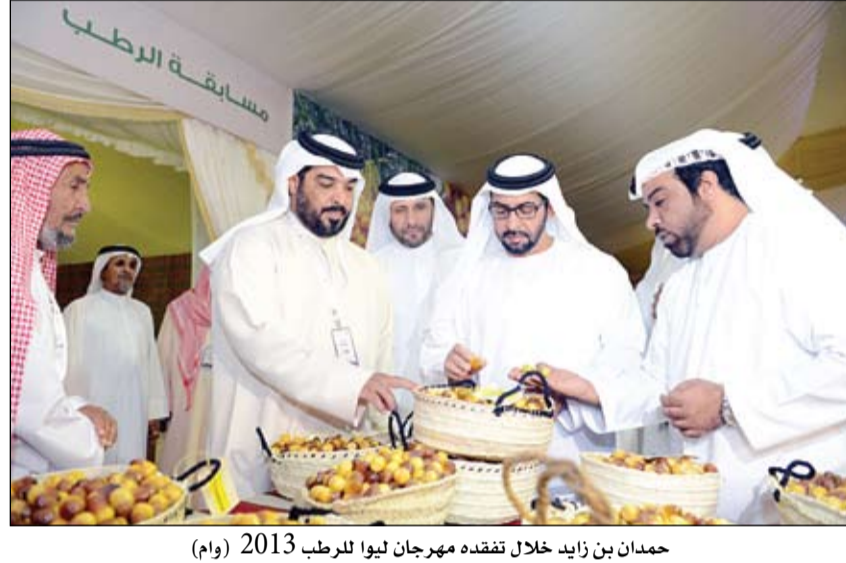
حمدان بن زايد خلال تفقده مهرجان ليوا للرطب 2013

نقطة نظام مصرية في وجه معزوفة تركية ناشاز..! الفجر: أعربت الرئاسة ووزارة الخارجية المصرية عن الاستياء الشديد تجاه تصريحات المسؤولين الأتراك حول مصر والذي اعتبرته القاهرة تدخلا صريحا في الشأن المصري، بعد اعتبار رئيس وزراء تركيا إزاحة محمد مرسي انقلابيا وعدم الاعتراف سوى به رئيسا شرعيا لمصر. وأكد احمد السلمانى المستشار الإعلامى للرئيس المصرى المؤقت، إن على أنقرة أن تعلم وتنتبه وهي تتكلم، أنها تتكلم عن دولة كبيرة مثل مصر ولها تاريخ ولن تقبل تدخلها في شؤونها. وكان رئيس الوزراء التركى رجب طيب اردوغان، اعتبر أن مرسي بعد عزله، هو رئيس الدولة الشرعي الوحيد في مصر. ونقل عنه قوله حاليا رئيسي في مصر هو مرسي لأنه انتخب من الشعب، واصفا عزل مرسي بأنه انقلاب عسكري. والسؤال، ما الذي يجعل تركيا تقف ضد إرادة أكبر الشعوب العربية؟ وهل إن خلفية حزب العدالة والتنمية الحاكم وأيديولوجية اردوغان، هي التي تدفع تركيا إلى أن تقف في صف الرئيس الإخواني المعزول، أي أن الشراكة الأيديولوجية فقط هي التي أممت مثل هذا الموقف، أم هو الخوف على مصر ومستقبل الديمقراطية فيها، واحترام للشريعة كما تزعم تركيا، وغيرها من الفروع الأخوانية على الخارطة العربية والعالمية؟ قبل الإجابة، لا بد من الإشارة إلى أن صعود الإخوان إلى السلطة في بعض البلاد العربية، واجبه بتبشير بالنموذج التركي، ودعوات إلى اعتمادها، وتكثفت المساعي في تلك الساعات إلى تمتين الروابط السياسية والاقتصادية مع تركيا، والاستعاضة بها عن العرب وقد استقبل اردوغان في بعض تلك الساعات، استقبال الأبطال والفاثحين. (التفاصيل ص 8)