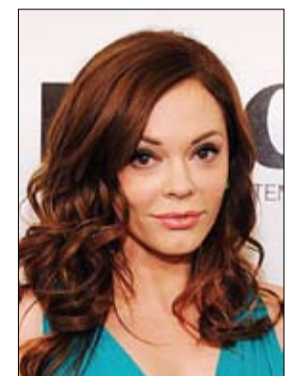
زواج نجمة (تشارلدا) روز مكفوان

تزوجت نجمة مسلسل تشارمد الممثلة روز مكفوان من حبيبها الفنان ديفي ديتايل. وذكر موقع بيبول أن مكفوان 40 عاماً التي اشتهرت في دور الساحرة بايغ ماثيوز في مسلسل تشارمد تزوجت من ديتايل في حفل زفاف أقيم بلوس أنجلس بحضور حوالي 60 شخصاً. وكانت مكفوان وديتايل أعلنوا عن خطوبتهما في تموز يوليو الماضي، يذكر أن مكفوان كانت على علاقة مع موسيقي الروك مارلين مامسون.