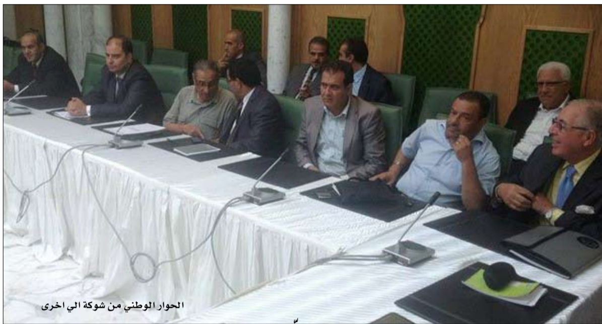
الحوار الوطني من شوكة الي اخرى