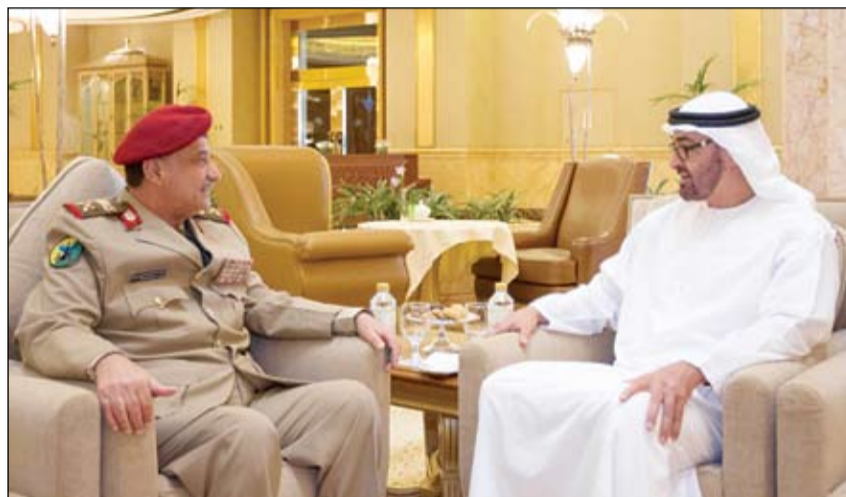
محمد بن زايد خلال استقباله وزير الدفاع اليمني (وام)

أبوظبي-وام: تلقى صاحب السمو الشيخ خليفة بن زايد آل نهيان رئيس الدولة حفظه الله.. برفقيات تهنئة من أخيه صاحب السمو الشيخ محمد بن راشد آل مكتوم نائب رئيس الدولة رئيس مجلس الوزراء حاكم دبي وإخوانه أصحاب السمو أعضاء المجلس الأعلى حكام الإمارات.. بمناسبة عيد الأضحى المبارك أعربوا فيها عن أطيب التهاني والتبريكات لسمو هذه المناسبة العزيرة على كل المسلمين.. داعين المولى العلي القدير أن يعيدها على صاحب السمو رئيس الدولة بصفور الصحة وعلى شعب الإمارات بمزيد من الرقي والتقدم والازدهار.. كما تلقى صاحب السمو رئيس الدولة برفقيات تهنئة مماثلة من سمو أولياء العهود ونواب الحكام بمناسبة عيد الأضحى المبارك.. وقد بعث أصحاب السمو أعضاء المجلس الأعلى حكام الإمارات وأولياء العهود ونواب الحكام.. برفقيات تهنئة مماثلة إلى قادة وأولياء عهود دول مجلس التعاون لدول الخليج العربية وإلى قادة ورؤساء الدول العربية والإسلامية بهذه المناسبة المباركة. تلقى صاحب السمو الشيخ خليفة بن زايد آل نهيان رئيس الدولة حفظه الله.. برفقيات تهنئة بمناسبة عيد الأضحى المبارك من كل من.. صاحب الجلالة السلطان قابوس بن سعيد سلطان عمان وصاحب