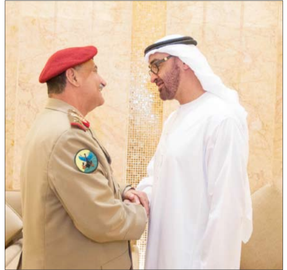
بحث مع وزير الدفاع اليمني سبل تعزيز العلاقات الأخوية

وأوضح معاليه أن استراتيجية الإمارات للتنمية الخضراء التي أعلنها صاحب السمو الشيخ محمد بن راشد آل مكتوم نائب رئيس الدولة رئيس مجلس الوزراء حاكم دبي رعاه الله تحت شعار اقتصاد أخضر لتنمية مستدامة جاءت لتؤكد أهمية التقنيات والنظم الخضراء الحديثة في تحويل الاقتصاد الوطني إلى اقتصاد متنوع مستدام منخفض الكربون يسهم في تحقيق التنمية المستدامة لجيل الحاضر وأجيال المستقبل حيث يمثل مسار التكنولوجيا الخضراء أحد المسارات الستة الرئيسية في الاستراتيجية والقاسم المشترك في المسارات الخمسة الأخرى. وذكر معالي وزير البيئة والمياه أن دور الإمارات لم يعد يقتصر على استخدام التقنيات بل أصبحت شريكا فاعلا في إنتاج التقنيات والحلول المبتكرة على الصعيدين الإقليمي والعالمي مشيرا إلى الاهتمام الواسع الذي توليه الإمارات للمؤسسات العملية والبحثية وتنمية القدرات الوطنية القادرة على المشاركة في استنباط الحلول المبتكرة لمواجهة الصغوظ والتحديات التي تواجهها التنمية المستدامة في كل المجالات منها في هذا الصدد إلى دور معهد مصدر للعلوم والتكنولوجيا والعديد من الجامعات والمعاهد المنتشرة في الإمارات وبالذات الذي تلعبه الجوائز العالمية التي أطلقتها الإمارات في تشجيع لطاقة المستقبل وجائزة دبي للفعل المستدام.. وغيرها. وفي ختام بيانه أكد معاليه الدور المهم للتقنيات والحلول المبتكرة في مختلف مجالات التنمية الاجتماعية والاقتصادية والبيئية داعيا إلى ضرورة تعزيز القدرات الوطنية في مجال العلوم التطبيقية والبحث العلمي واستثمار وتوظيف التقنيات والحلول المبتكرة بأفضل صورة ممكنة لتحقيق التنمية المستدامة التي تمثل جوهر رؤية الإمارات 2021 والمحافظة على المكانة المرموقة التي تحتلها الإمارات على الصعيدين الإقليمي والدولي.