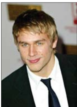
هونام ينسج من

تزوج نجم مسلسل رجال مجانيين Mad Men بن فيلدمان من حبيبته ميشال موليتز في مزرعة بماريلاند. وذكر موقع (يأس ويكلي) أن فيلدمان (33 عاماً) وموليتز احتفلا بزفافهما بمشركة 350 ضيفاً من الأقارب والأصدقاء.