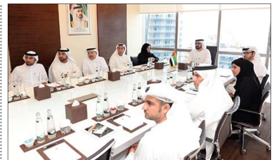
محمد بن راشد خلال لقائه فريق العمل في الأمانة العامة لمجلس الوزراء (وام)

اسرائيل تفرج عن 26 أسيرا وتشن حملة اعتقالات جديدة القدس المحتلة-وكالات: لوح وزير شؤون المخابرات الإسرائيلي، يوفال شطايينيس، الاثنين، بشن هجوم عسكري ضد قطاع غزة، وذلك في أعقاب سقوط صاروخي قسام جنوب إسرائيل الليلة قبل الماضية، وشدد على أن إسرائيل التزمت بإطلاق سراح الدفعة الثانية من الأسرى الفلسطينية. وقال شطايينيس للإذاعة العامة الإسرائيلية، إنه يقدر أنه في حال استمرار أو تصاعد إطلاق الصواريخ من قطاع غزة، فإنه لن يكون خيارا أمامنا سوى بحسم هذا الأمر، عاجلا أو آجلا. وأضاف لا أعرف متى، لكن توجد في غزة مشكلة لم يتم حلها بعد، ولا أرى كيف أن العملية السياسية مع الفلسطينيين ستقود إلى حل. وأعلن الجيش الإسرائيلي أن طيرانه الحربي قصف منصات لإطلاق الصواريخ في قطاع غزة. على صعيد آخر أعلنت حركة حماس أن إسرائيل اعتقلت اثنين من نوابها في المجلس التشريعي في الضفة الغربية بالإضافة لاعتقال أحد قادة الحركة، وكان نادي الأسير الفلسطيني قد أعلن أن جيش الاحتلال اعتقل عشرة بين شاب وطفل الشهر الجاري في الخليل. وتأتي حملة الاعتقالات هذه بينما قررت الحكومة الإسرائيلية أمس الإفراج عن 26 أسيرا فلسطينيا في مرحلة ثانية من اتفاق توسطت فيه الولايات المتحدة في يوليو تموز الماضي مقابل استئناف محادثات السلام.