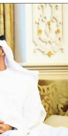
محمد بن زايد خلال استقباله النائب الأول لرئيس مجلس الوزراء الصربي

بتوجيهات رئيس الدولة تنفيذ 21 مشروعا تنمويا جديدا في باكستان دبي-وام: تنفيذًا للتوجيهات السامية والمبادرات الكريمة لصاحب السمو الشيخ خليفة بن زايد آل نهيان رئيس الدولة حفظه الله بدعم ومساعدة أبناء الشعب الإماراتي والمساهمة في تطوير مناطقه ومدنه وتزويدها بالمرافق التنموية الحديثة وتوفير الخدمات الأساسية للمجتمع في مجالات الطرق والجسور والتعليم والصحة والمياه .. أعلنت إدارة المشروع الإماراتي لمساعدة باكستان عن بدء تنفيذ 21 مشروعا تنمويا جديدا في جمهورية باكستان الإسلامية بتكلفة قدرها 184 مليوناً و200 ألف دولار أمريكي وفتح وبناء مستشفى رئيسي في العاصمة إسلام آباد وتنفيذ 7 مشاريع تعليمية حديثة بالإضافة إلى إنشاء محطات معالجة وتنقية المياه ومد شبكات التوصيل لتوفير المياه الصالحة للشرب لـ 12 قرية نائية. (التفاصيل ص3)