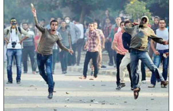
بلطجية الإخوان يرشقون قوات الامن بالحجارة شمال شرق القاهرة

بلطجية الإخوان يقتلون 3 من الشرطة المصرية القاهرة-وكالات: قتل ثلاثة من رجال الشرطة المصرية عندما هاجم ملثمون نقطة فتيش في مدينة المنصورة الواقعة في منطقة الدلتا شمالا، بحسب ما ذكرته مصادر أمنية مصرية. ولم تتبن أي جماعة المسؤولية عن الهجوم لكن بلطجية الإخوان المجرمين عادة ما يقومون بمثل هذه الهجمات، وكان ثلاثة رجال يستقلون سيارة، ورايع يستقل دراجة نارية، قد اقتربوا من نقطة الفتيش فجر الاثنين، ثم أطلقوا النيران على الشرطة عن قرب حتى يتأكدوا من مقتلهم. يأتي ذلك في وقت وقعت فيه مفاوضات محدودة بين عناصر من الأمن المصري ومئات من طلاب جامعة الأزهر يناصرون الرئيس المعزول محمد مرسي، بعد ظهر الاثنين، بعد أن قطعوا أسلاكًا شائكة بطريق النصر شمال شرق القاهرة متوجهين إلى منطقة رابعة العدوية.