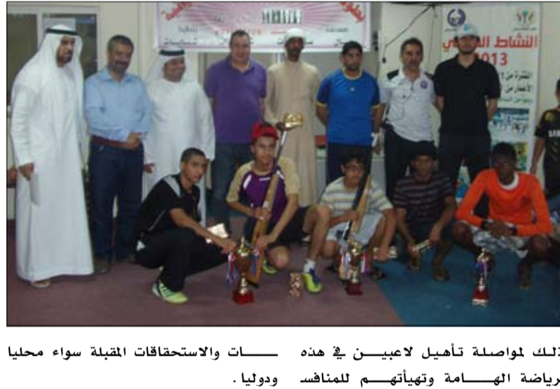
وذلك مواصلة تأهيل لاعبين في هذه الرياضة الهامة وتجهيأتهم للمنافسة ودوليا .

اختتم مجلس الشارقة الرياضي ونادي الذيد التقايع الرياضي مساء امس البطولة الصيفية للرمية الهوائية والتي اقيمت بصالة الرماية بنادي الذيد للرمية وشارك فيها رماة يمثلون أربع أندية بيمارة الشارقة وهي نادي الشعب ونادي الذيد ونادي محليه ونادي الخليج . وكانت البطولة قد بدأت فعالياتها بحماس كبير وبمشاركة لافتة من قبل رماة الأندية وتواصلت البطولة في حماس كبير وباستعداد فني عالي المستوى من حجم المنافسة والمشاركة والتنظيم اللافت من قبل مجلس الشارقة الرياضي في طرح منافسات رياضية ومتنوعة في مختلف المجالات لسيما الرياضية بالتعاون مع الأندية العاملة في إمارة الشارقة ومن بينها بطولة الرماية بالتعاون مع إدارة نادي الذيد.