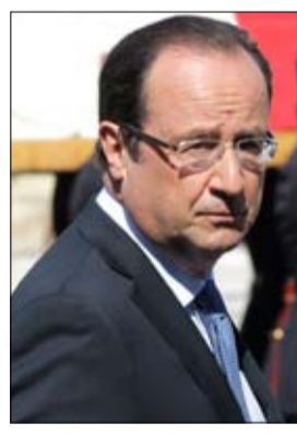
الرئيس الفرنسي نيكولا ساركوزي

قبل اذاعة، قبل شهر في سوريا. واستقبل هولاند الاثنين عائلتي الصحافيين، بينما من المقرر ان تجتمع لجنة دعم ترأسها الصحافية فلورانس اوبينا امام مقر اوروبا 1- وشدد موقعه الرسالة التي وجهت اخيرا الى هولاند ومنهم وكالة فرانس برس ولوموند وليبراسيون ولوفياغور وتي اف ا- وفرانس 2- و بي اف ام تي في و ار تي ال وفرانس انفو، بالإضافة الى عدد كبير من الصحف اليومية المحلية، على الأهمية القصوى التي يولونها جميعا