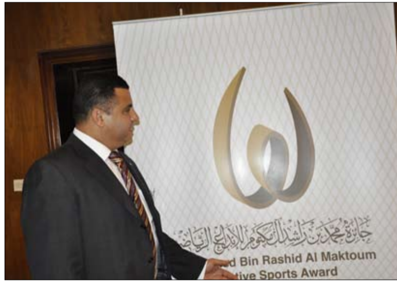
و جاء تنظيم مؤتمر الإبداع الرياضي بهدف أكاديميين نحو فتح مجالات وأفاق أكبر للأفكار التطبيقية الإبداعية، وتطوير آليات