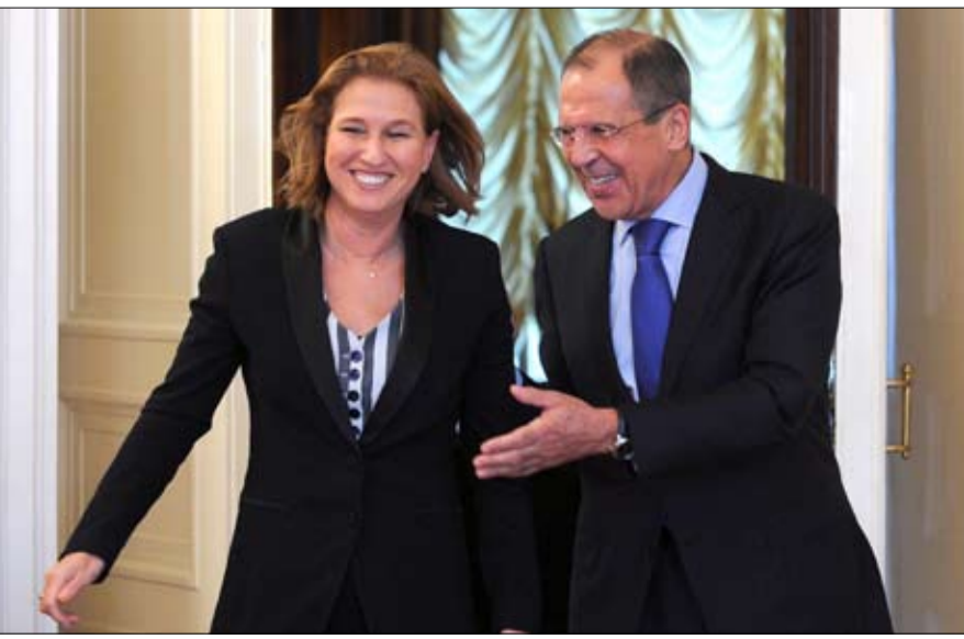
الوزيرة الإسرائيلية تسيبي ليفني مع نائب وزير الدفاع الروسي سيرغي فلوروف

ذكرت اذاعة الجيش الاسرائيلي الثلاثاء ان وزيرة العدل الاسرائيلية تسيبي ليفني توجهت امس الى روسيا لمحاولة منع تسليم شحنة صواريخ اس 300- الى نظام الرئيس السوري بشار الاسد. وتلتقي ليفني خلال زيارتها خصوصا لمنع بيع هذه الصواريخ، كما قال المصدر نفسه. وردا على سؤال لوكالة فرانس برس، أكدت ناطقة باسم ليفني زيارة وزيرة العدل الى موسكو وقرب لقائها لاهرف لكتها نفت ان تكون الوزيرة تنوي اشارة ملف صواريخ اس-300. وتسليم الصواريخ اس 300- القادرة على اعتراض طائرات او صواريخ موجهة في الجو سيزيد من صعوبة شن هجمات جوية اسرائيلية محتملة في سوريا او في لبنان كما حذر القادة الاسرائيليون الذين اشاروا ايضا ال احتمال وقوع هذه الاسلحة