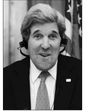
الرئيس المصري محمد مرسي

طالبت إسرائيل الولايات المتحدة بعدم تقليص المساعدات للجيش المصري تحسبا من تأثير ذلك على تدهور الوضع الأمني في سيناء بحسب ما نقلته صحيفة هآرتس الإسرائيلية. ونقلت هآرتس أمس عن موظف رفيع المستوى في الإدارة الأميركية قوله إن حكومة إسرائيل توجت خلال الأيام الأخيرة بواسطة عدة قنوات اتصال إلى مسؤولين في الإدارة الأميركية وطلبت عدم المس بالمساعدات (1.3 مليار دولار) التي تمنحها الولايات المتحدة للجيش المصري سنويا. وقالت الصحيفة إنه