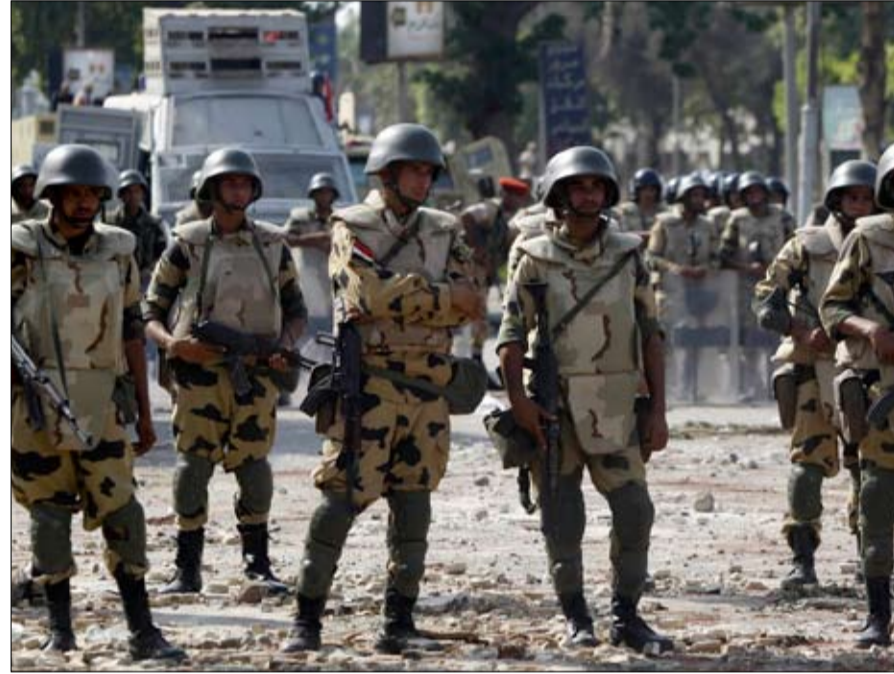
عناصر الجيش المصري في ميدان التحرير

وفيما يتعلق بالمساعدات العسكرية لمصر في الفترة القادمة، قال المتحدث نعتقد أن المساعدات العسكرية التي تقدمها مصر تمثل عاملا يبعث على الاستقرار في المنطقة، ونرى أن وقف هذه المساعدات في الوقت الحالي لن يكون مثمرا. نحن نقيم الموقف ونستخذ قرارنا في المستقبل في الوقت المناسب.