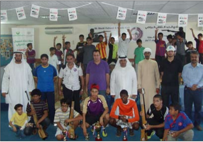
وذلك مواصلة تأهيل لاعبين في هذه الرياضة الهامة وتجهيأتهم للمنافسة ودوليا .