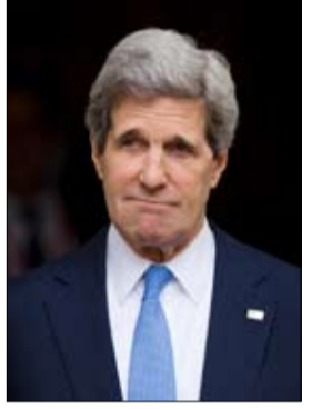
الظاهرة السلفية تزج التونسيين

منصبه في الأول من فبراير شباط في أن يقع الصين باستخدام نفوذها الاقتصادي والدبلوماسي لتكبح جماح بيونجيانج وطغمة اليابان وكوريا الجنوبية خليفتي واشنطن. وقال مسؤول أمريكي كبير للصحفيين الذين يسافرون مع كيري نريد منهم حقا.. توجيه رسائل صارمة إلى بيونجيانج بشأن نزع السلاح النووي. ويصل كيري إلى سول عاصمة كوريا الجنوبية ويوزر بكين وطوكيو. وأضاف المسؤول أن وزير الخارجية الأمريكي يريد أيضا توصيل رسالة واضحة لسول وطوكيو مفادها نحن مستعدون وأن التحالف مسألة مهمة وليست محل شك وأنتنا سندافع عنهم.