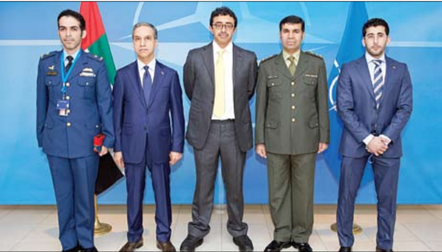
ومساندتها الميدانية وفرض التدريب التي قدمتها لأعضاء وعسكر الجيش الوطني الافغاني. وتعتبر دولة الإمارات أول دولة عربية خليجية يكون لها مقر في حلف شمال الأطلسي في بروكسل.

وحول ما يمكن أن تقدم الإمارات للناتو بصفتها عضواً في مبادرة اسطنبول قال المسؤولون الإماراتيون أعضاء على مستوى الحوار السياسي ام على مستوى التعاون العملي مع الناتو.. فالإمارات عملت عن قرب معنا من أجل تحقيق الاستقرار والأمن في مناطق عدة من البوسنة إلى أفغانستان إلى ليبيا وقد تعاونت قواتنا معاً بفعالية كبيرة على الأرض وفي الجو.. ونحن نشكر للإمارات دعمها السياسي