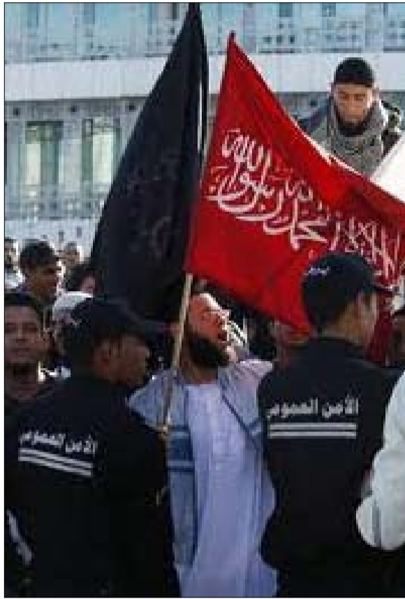
الظاهرة السلفية تزج التونسيين

عرض سيلفيو برلسكوني رئيس الوزراء الايطالي الاسبق دعم سياسي من يسار الوسط في الانتخابات الرئاسية القادمة لكنه تمسك بمطلب تشكيل تحالف حكومي واسع يشترك فيه في السلطة وقال مستعدون لمناقشة هذا مشيرا الى انتخاب عضو من الحزب الديمقراطي للانتخابات الرئاسية القادمة في ايطاليا وحين سئل عما اذا كان لا يزال مصرا على ان يدخل يسار الوسط في تحالف مع حزب شعب الحرية الذي يتزعمه كشرط لكسب هذا التأييد أجاب بالقطع هذا واضح. وتنتهي فترة رئاسة الرئيس الايطالي الحالي جورجيو نابوليتانو في 15 مايو ايار المقبل وانتخاب رئيس جديد للبلاد هو اكبر اختبار قادم للبرلمان المنقسم بين الكتلتين التقليديتين يمين الوسط ويسار الوسط إضافة الى حركة الخمسة نجوم.