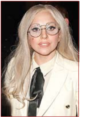
فاغا تجهد نشاطها حتى سبتمبر

كشفت صور مذهلة عن قيام تمساح في الفلبين بابتلاع خنزير ضخم يصل وزن رأسه إلى حوالي 6.5 كيلوجرام. وقالت صحيفة الديلي ميل البريطانية إن التمساح الضخم يبلغ طوله حوالي خمسة أمتار، ويعيش في حديقة باسا سيتي بالعاصمة الفلبينية مانيلا. وحسب الصحيفة، يمكن لتمساح البحار أن يعيش حتى 70 عاماً، ويصل طوله أحياناً إلى ستة أمتار، ووزنه إلى نصف طن. وأضافت الصحيفة: ليس غريباً على هذا النوع من التماسيح، الذي يعيش في المياه المالحة، أن يبتلع خنزيراً بهذا الحجم إذا جاع، حيث عرف عنه أنه يمكن أن يبتلع جاموساً وقرداً، أو حتى سمكة قرش. ويمكن هذا التمساح بالقرب من سطح الماء، ثم يبتلع على فريسته ويجرها إلى الماء، مستخدماً في ذلك ذيله وأنيابه القوية. وتعد منطقة جنوب شرق آسيا وأستراليا موطن لتمساح البحار.