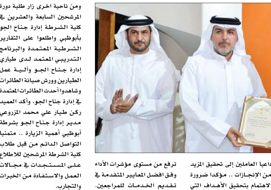
داعياً العاملين إلى تحقيق المزيد من الإنجازات.. مؤكداً ضرورة الاهتمام بتحقيق الأهداف التي ترفع من مستوى مؤشرات الأداء وفق أفضل المعايير المتقدمة في تقديم الخدمات للمراجعين. والعمل والاستفادة من الخبرات والتجارب.