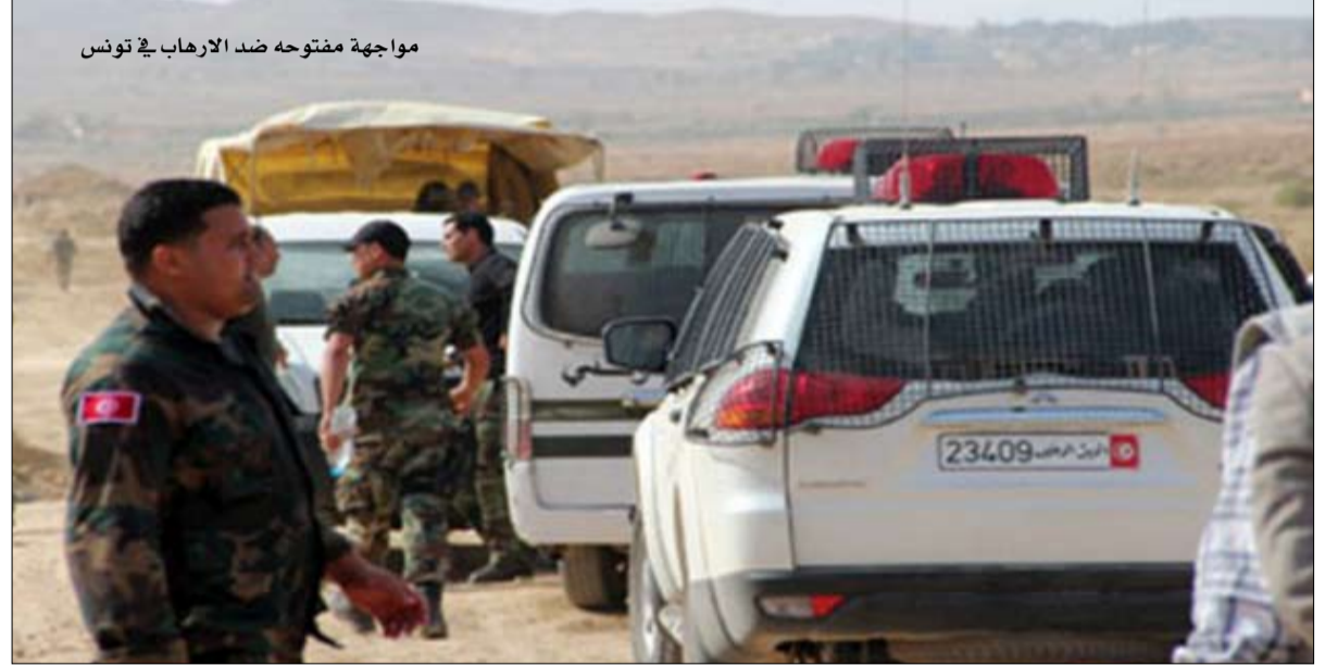
مواجهة مفتوحة ضد الارهاب في تونس