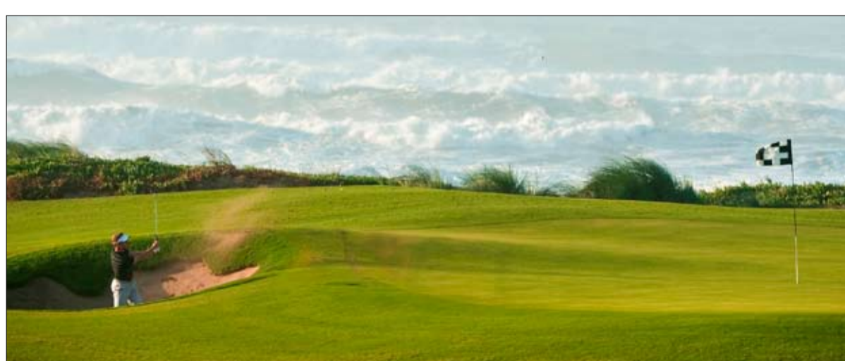
وتولى إنجاز منتج مازاغان مجموعة كيرزرنر الدولية، وتم اعتبار أنه يتمتع بمناخ معتدل على مدار العام.

غرفة مطلة على مناظر خلابة على المحيطات والبحيرات وملعب الغولف والحدائق والأراضي الشاسعة وحمام السباحة المميز في المنتج. ويضم المنتج منطقة مفتوحة على مساحة 250 هكتاراً تشمل ملعب جولف يحتوي 18 حفرة صممه جاري بلاير كما ان المنتج يشمل شاطئاً يمتد على طول 7 كيلومتر او مجموعة متنوعة من المطاعم ومنتج صحي ومرافق مميزة لممارسة الأنشطة الرياضية والترفيهية وواحدة من أكبر مراكز المؤتمرات في المنطقة والى جانب ملعب الجولف، يشمل المنتج 67 فيلا فاخرة ساحلية.