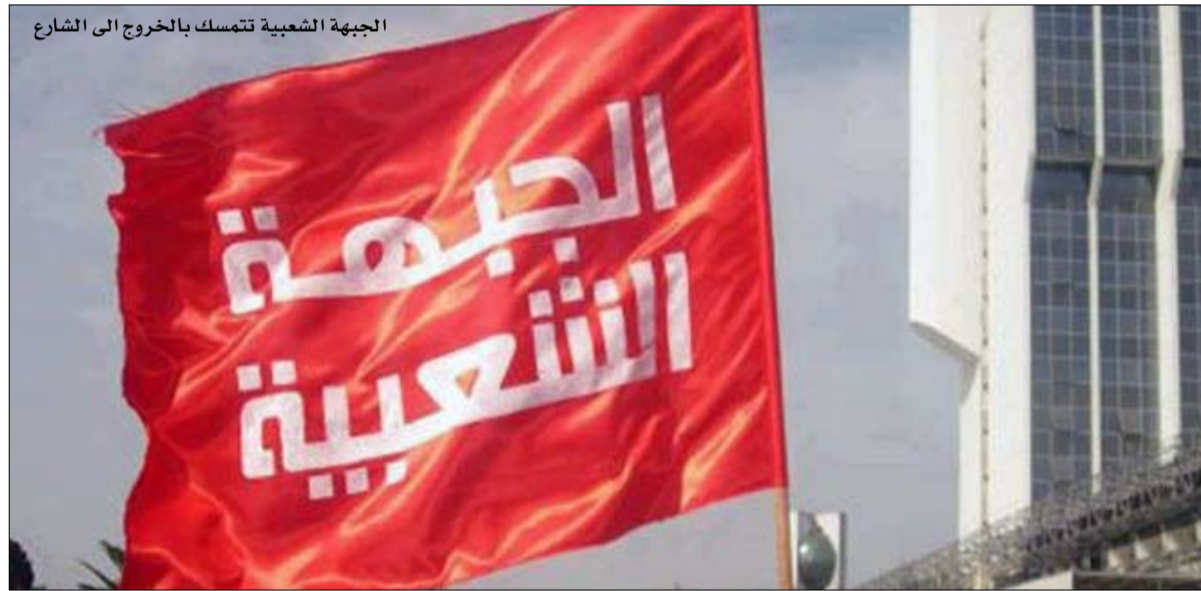
الجبهة الشعبية تتمسك بالخروج الى الشارع