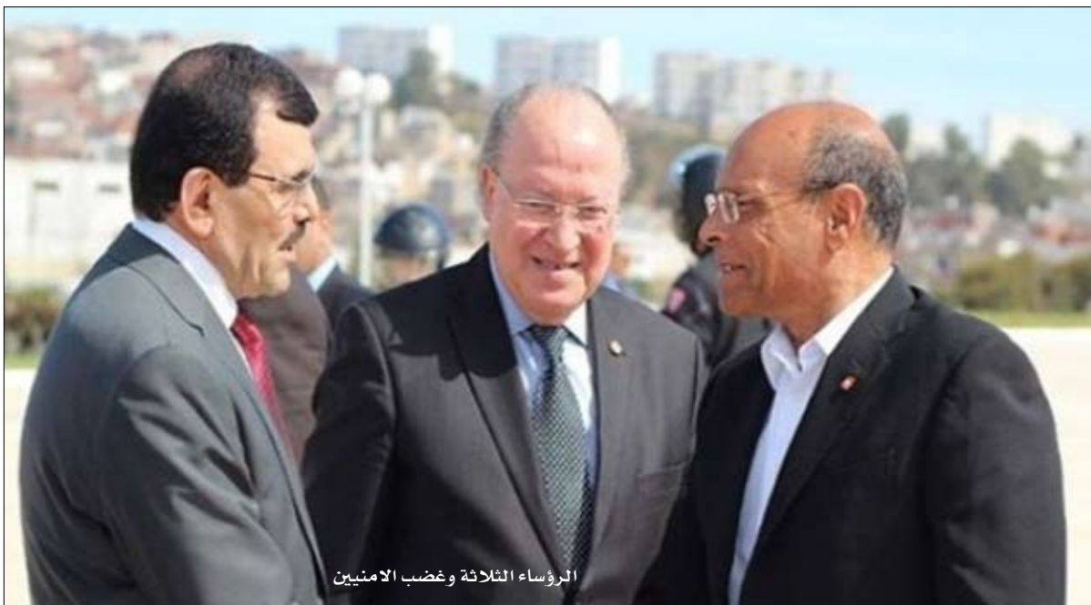
الرؤساء الثلاثة وغضب الامنيين

لواجهة شاملة تجمع بين المعارضة السياسية والمؤسسة الأمنية. وفي هذا السياق كشفت مصادر إعلامية تونسية أن لقاء إيجابيا جمع السبت بين رئيس الحكومة المؤقت علي العريض والأمين العام لاتحاد الشغل حسين العباسي.