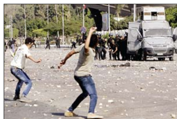
بلطجية الإخوان يلقون الحجارة على قوات الامن

الإلكتروني في محاولة لكسب الرأي العام، غير أن مواقع الجماعة نالت انتقادات متزايدة بسبب استخدام صور لضحايا النزاع في سوريا على أنها صور لضحايا ما تقول إنه قمع الأمن لتظاهرات أنصار الجماعة. وحمل أنصار الرئيس المعزول محمد مرسي إلى مواقع إلكترونية تابعة للجماعة مشاهد تعكس عنفا، وصور ضحايا في حروب أخرى، بغرض شحن الرأي العام ضد الحكم الحالي في مصر. وحذرت إدارة فيسبوك مراراً من إغلاق حسابات مديري صفحات تابعة لجماعة الإخوان في حال أعدوا نشر صور سبق إلغاؤها.