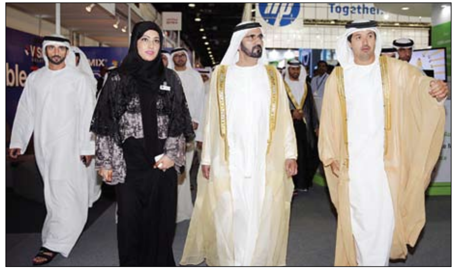
محمد بن راشد خلال افتتاحه معرض جيتكس

تلقي صاحب السمو الشيخ خليفة بن زايد آل نهيان رئيس الدولة حفظه الله برقية تهنئة من فخامة الرئيس جيمس ماكس مايكل رئيس جمهورية سيشل بمناسبة عيد الأضحى المبارك. وأعرب فخامته في برقيته عن خالص تهنائه لصاحب السمو رئيس الدولة متمنياً لدولة الإمارات وشعبها دوام التقدم والازدهار. من جهة أخرى أصدر صاحب السمو الشيخ خليفة بن زايد آل نهيان رئيس الدولة حفظه الله