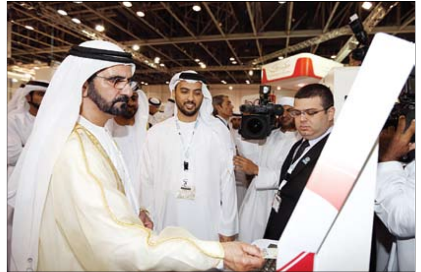
افتتح معرض جيتكس