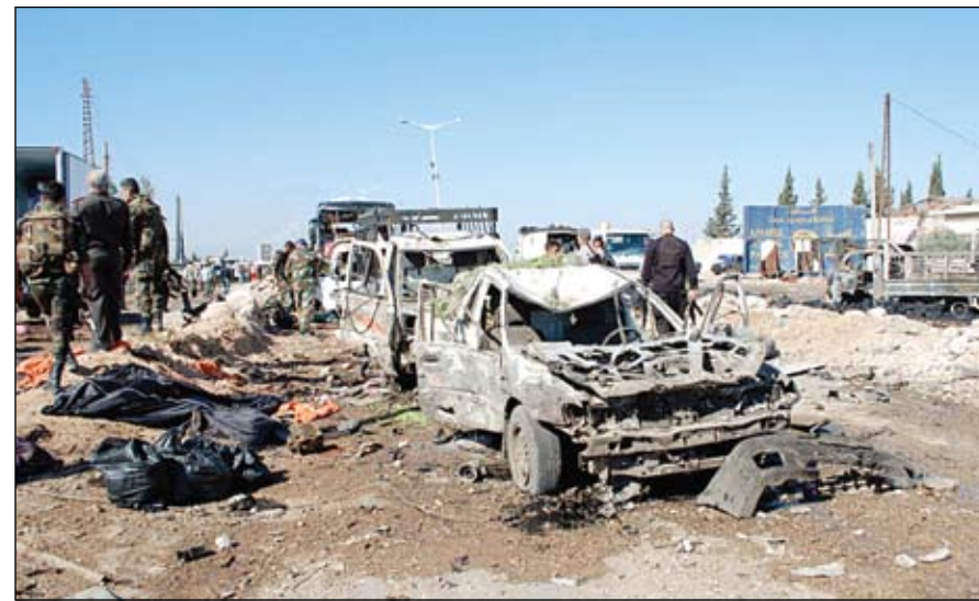
الامن السوري يعاين موقع انفجار السيارة المشخخة على أطراف مدينة حماة

للأدوية حوّلته قوات النظام إلى تكتة عسكرية. ويقول مراقبون إن من شأن هذا التطور أن يهدد طريق الثوار للوصول إلى حي جرمانا في العاصمة دمشق. في غضون ذلك، قال مركز صدى السوري الحر وقوات النظام. وتشهد الجبهة الشمالية مدينة المعصية اشتباكات عنيفة، وسط قصف مدفي. وكان مقاتلو المعارضة المسلحة في الغوطة الشرقية قد أعلنوا في وقت سابق سيطرتهم على معمل