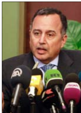
القاهرة-يو بي أي:

القاهرة-يو بي أي: غادر وزير الخارجية المصري نبيل فهمي القاهرة، صباح الأحد، متوجهاً إلى العاصمة الأوغندية كمبالا على رأس وفد وزاري، في مستهل جولة أفريقية تشمل بوروندي، والكونغو الديمقراطية. وتوجه فهمي يرافقه وزير الزراعة واستصلاح الأراضي أيمن أبو حديد، والإسكان والمرافق والمجتمعات العمرانية الجديدة إبراهيم محلب، إلى العاصمة الأوغندية كمبالا في بداية جولة أفريقية تشمل دولتي بوروندي والكونغو الديمقراطية حيث يجري الوفد