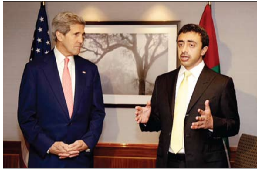
عبد الله بن زايد خلال لقائه جون كيري

عملية عسكرية واسعة في جبل الشعانبي حوار الصم في تونس بين المعارضة وحركة النهضة الفجر - تونس - خاص اعلن متحدث باسم القوات المسلحة التونسية ان الجيش يقوم بعملية جوية وبرية واسعة النطاق ضد اراهابيين في جبل الشعانبي بالقرب من الحدود الجزائرية. وقال الناطق باسم الجيش توفيق رحومني لاذاعة موزايك (اف ام) ان اشتباكات بدأت حوالي الساعة 22.00 (21.00 ت غ) من يوم (الخميس) بين العسكريين ومجموعة اراهابية. واضاف ان عملية واسعة النطاق بمشاركة وحدات جوية وبرية بدأت فجر امس الجمعة. وتابع لم تقتل ولم توفى اي اراهابي حاليا. موضحا انه لا يمكن ان يقول عدد افراد المجموعة المسلحة. ويطارد الجيش التونسي في جبل الشعانبي بولاية القصرين (وسط غرب) على الحدود مع الجزائر اراهابيين قتلوا ثمانية عسكريين تونسيين يتحصنون فيها على ما افاد مراسل فرانس برس نقلا عن مصادر أمنية. سياسيا يستمر اعتصام الرحيل، وفي مواجهته اعتصام الموالاة والشريعة، مع ماراتون سياسي يشهده القصر الرئاسي في محاولة للخروج من الأزمة، وفي الحد الأدنى تخفيف الاحتقان والتقليص من تداعياته، خاصة أن تونس تشهد حربا باتت معلنة ومفتوحة على الارهاب يخوض غمارها الجيش التونسي على الحدود الجزائرية. ويبدو أن الانقسام السياسي ليس في طريقه إلى الحلحلة، ومازال كل طرف يقف على ليله، ويعزف على وتر مواقفه، ويبدو أيضا أن حركة النهضة الإسلامية قد اختارت الهروب إلى الامام، في حين تمتدست المعارضة في خندقها الرفض رغم كثرة الحلول الوسط المطروحة والمقترحة من أطراف سياسية واجتماعية. وهذا الوضع، يؤشر إلى صعوبة حل العقدة القائمة، وازدياد حذو الاحتكام إلى الشارع لحسم الصراع. (التفاصيل ص 7)