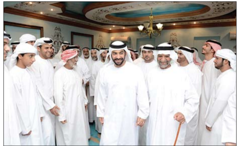
حمدان بن زايد خلال زيارته خادم محمد الرميثي

بحث مع كيري الوضع المصري وعملية السلام عبد الله بن زايد يؤكد أهمية دعم قيادة مصر إلى مستقبل أفضل لندن-وام- التقى سمو الشيخ عبدالله بن زايد آل نهيان وزير الخارجية في العاصمة البريطانية لندن امس معالي جون كيري وزير خارجية الولايات المتحدة الأمريكية. وتم خلال اللقاء بحث أوجه التعاون الوثيق بين الامارات وأمريكا ..، والوضع في مصر وعملية السلام في الشرق الأوسط. وفي بداية الاجتماع قال سمو الشيخ عبدالله بن زايد: إننا نعتقد أنه من المهم جدا أن نرى القيادة الأمريكية تساعد في تهدئة الوضع في مصر وكذلك جهودكم في إعادة الحياة إلى عملية السلام. وأضاف سموه إننا نرى أن الجهود الكبيرة التي تبذلها الولايات المتحدة الأمريكية وأنتم شخصيا بدأت تؤتي ثمارها وستجدون كل التأييد من الجانب العربي. (التفاصيل ص 2)