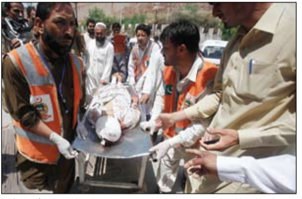
رجال الاسعاف يخلون الجرحى من موقع انفجار وقع في بيشاور

عواصم-وكالات: أعلن الجيش السوري الحر أنه سيطر على كتيبي الدفاع الجوي والرادار وسرية الإشارة في بلدة النعيمة بريف درعا، وقال ناشطون إن التوار اقتحموا مطار أبو الظهور قرب إدلب وسيطروا على جزء منه، يأتي هذا وقد وثقت الشبكة السورية لحقوق الإنسان سقوط نحو أربعين قتيلًا امس الأحد. وأحكم الجيش الحر حصاره أيضا على كتيبة الخضراء، كما بدأ في حصار اللواء الرابع والثلاثين مدرع التابع للفرقة التاسعة وقسم الأمن العسكري في المنطقة، وذلك في إطار ما سماها الجيش السوري الحر معركة بركان حوران. في هذه الأثناء وثقت الشبكة السورية لحقوق الإنسان يوم امس سقوط أربعين قتيلًا في محافظات سورية مختلفة، معظمهم في حلب، بينهم ستة أطفال وأربع سيدات و 18 قتيلًا من الثوار المسلحين. وقالت الشبكة إن القتلى موزعين على حلب التي قتل فيها 13 شخصا، وإدلب ودرعا حيث قتل سبعة أشخاص في كل منهما، بالإضافة إلى خمسة