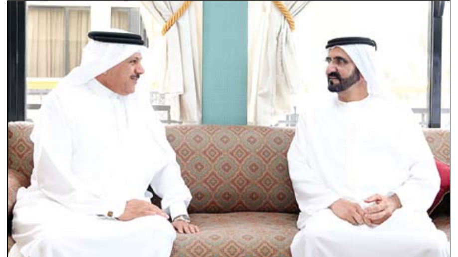
محمد بن راشد خلال استقباله أمين عام مجلس التعاون الخليجي

أبوظبي-وام: التقى الفريق أول سمو الشيخ محمد بن زايد آل نهيان ولي عهد أبوظبي نائب القائد الأعلى للقوات المسلحة امس بقصر الإمارات فضيلة الإمام الأكبر الدكتور أحمد الطيب شيخ الأزهر الشريف الذي يزور البلاد حالياً. ورحب الفريق أول سمو الشيخ محمد بن زايد آل نهيان ولي عهد أبوظبي نائب القائد الأعلى للقوات المسلحة امس بقصر الإمارات فضيلة الإمام الأكبر الدكتور أحمد الطيب شيخ الأزهر الشريف الذي يزور البلاد حالياً. ورحب الفريق