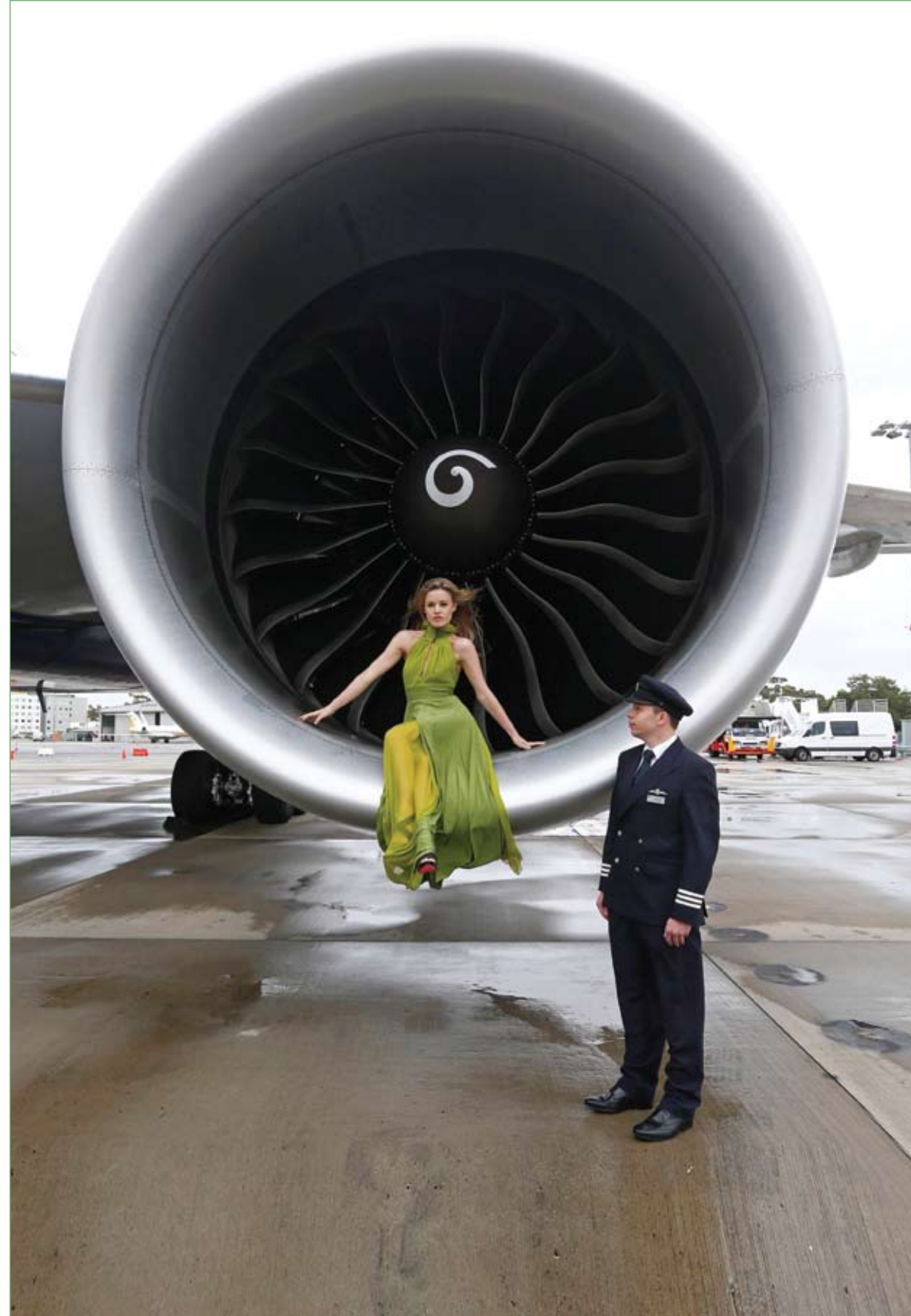
عارضة الأزياء البريطانية جورجيا ماي جاغر في صورة تجلس على أحد المحركات التوربينية لطائرة بريطانية جديدة من طراز 700ER-777 تابعة للخطوط الجوية في مطار سبدي.

وكانت مسألة العنف ضد النساء قد صدّرت الأجنّدة الحكومية في الهند .