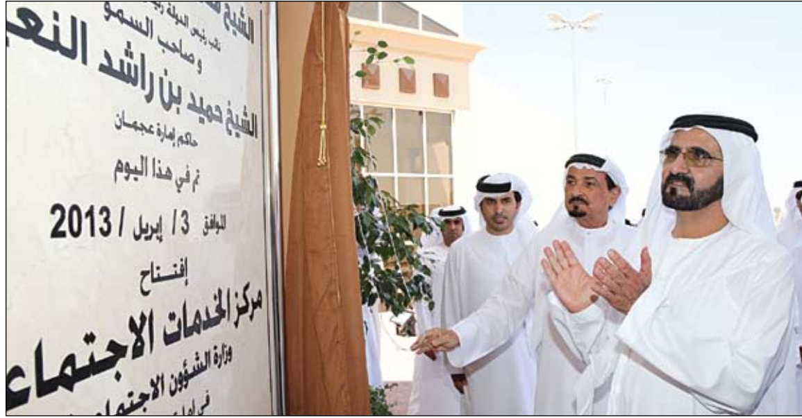
محمد بن راشد يدشن مركز الخدمات الاجتماعية في عجمان بحضور حميد بن راشد النعيمي