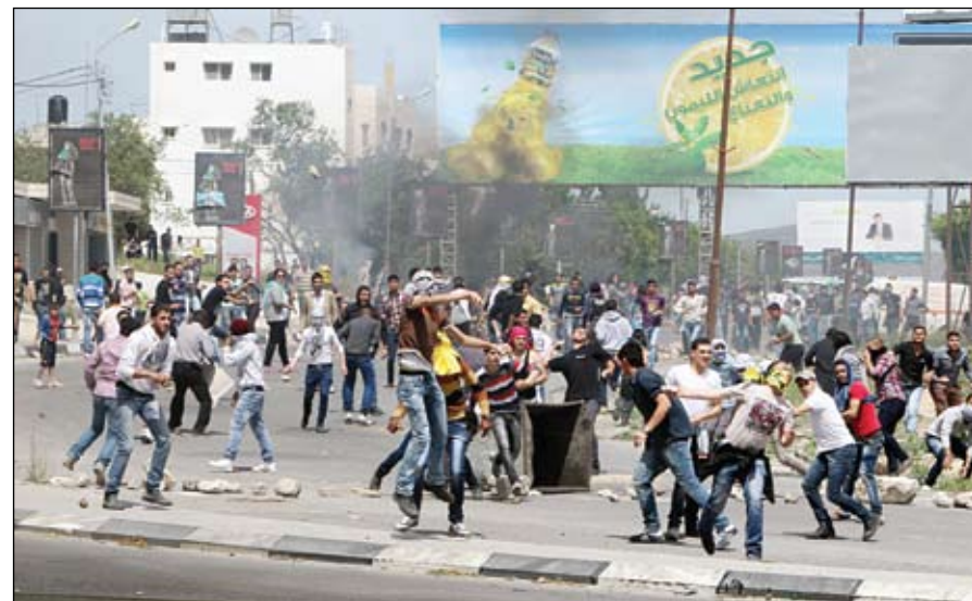
فلسطينيون يرقون جنود الاحتلال بالحجارة خلال مظاهرة غضب لوفاة الأسير ميسرة

شنت طائرات إسرائيلية ليل الثلاثاء الأربعاء غارتين على مناطق مختلفة في قطاع غزة، من دون وقوع إصابات. في تطور هو الأول من نوعه منذ اتفاق وقف إطلاق النار بين إسرائيل وحركة حماس في تشرين الثاني نوفمبر الماضي. وقال مصدر أمني فلسطيني، إن طائرات استطلاع إسرائيلية أطلقت صاروخاً واحداً على الأقل تجاه أرض خالية شمال قرية (أم النصر) شرق بلدة بيت لاهيا شمال قطاع غزة بدون أن يبلغ عن وقوع إصابات حتى الآن. وأطلقت الطائرات أيضاً صاروخاً تجاه أرض زراعية شمال شرق مدينة غزة، لم يودع أي وقوع إصابات. وهذه الغارات الإسرائيلية هي الأولى من نوعها منذ اتفاق وقف إطلاق النار بين إسرائيل وحماس الذي أنهى ما سُمّيها إسرائيل عملية عمود السحاب التي دامت