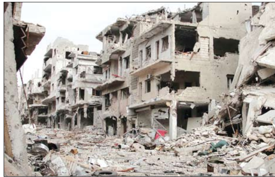
دمار هائل نتيجة القصف المستمر على مدينة حمص

أجبر التقدم النوعي المتسارع للجيش الحر على أكثر من جبهة، النظام السوري على إعادة ترتيب حساباته، فبعد فشل محاولاته الجاهدة لاستعادة مناطق ومطارات وقواعد عسكرية مهمة سيطر عليها الجيش الحر في مناطق متفرقة من سوريا، تحول النظام إلى التركيز على تعزيز قبضته على المناطق التي لاتزال خاضعة لسيطرته ومن بينها دمشق. وبحسب وسائل إعلام رسمية سورية تقضي خطة النظام الجديدة بإعادة رسم خارطة المحافظات السورية الـ14 وإعادة تقسيمها على أساس المناطق التي مازال يحتفظ بها النظام لاسيما في حلب وحمص والحسكة.