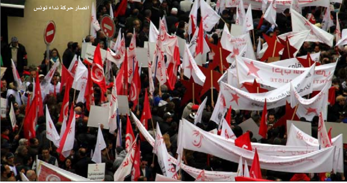
انصار حركة نداء تونس