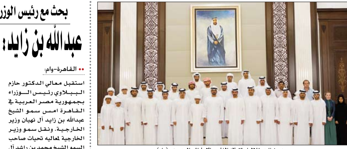
محمد بن زايد خلال استقباله الفارس الإماراتي الجهوري

القاهرة-وام: استقبل معالي الدكتور حازم الببلاوي رئيس الوزراء بجمهورية مصر العربية في القاهرة أمس سمو الشيخ عبدالله بن زايد آل نهيان وزير الخارجية. ونقل سمو وزير الخارجية معاليه تحيات صاحب السمو الشيخ محمد بن راشد آل مكتوم نائب رئيس الدولة رئيس مجلس الوزراء حاكم دبي رعاه الله والضييق أول سمو الشيخ محمد بن زايد آل نهيان ولي عهد أبوظبي نائب القائد الأعلى للقوات المسلحة. وأكد سمو الشيخ عبدالله بن زايد آل نهيان اللقاء على مكانة مصر الكبيرة في العالم العربي.. وقال: إن استقرار مصر هو استقرار لكل العرب.. مشددا سموه على حرص الإمارات بقيادة وشعبا على الوقوف بجانب مصر بكل قوة خلال المرحلة الراهنة وتقديم كافة أشكال الدعم الممكن لها ليس فقط من خلال حزمة المساعدات والقروض لدعم الاحتياطي النقدي وإنما أيضا من خلال برامج تنموية في الأجلين المتوسط والطويل بهدف تطوير وإعادة العديد من قطاعات الاقتصاد القومي. (التفاصيل ص3)