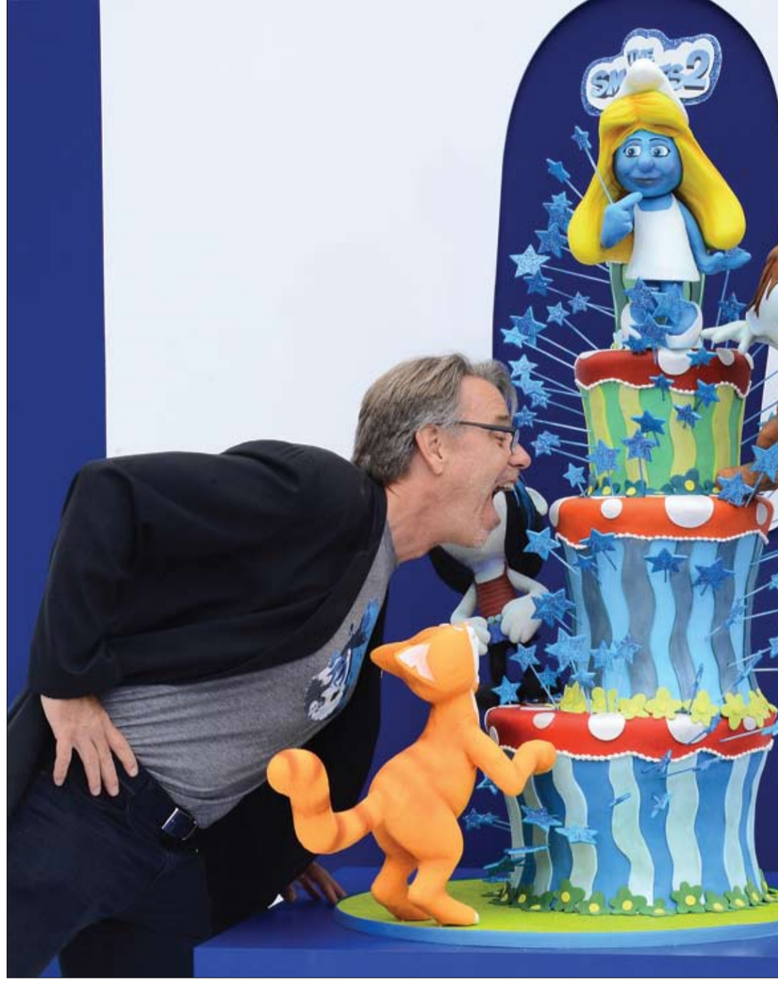
الخرج رجا جوسنيل لدى حضوره العرض الأول لفيلمه الجديد للرسم المتحركة الكوميدي سنفور 2 في لوس أنجلوس.

ذكرت دراسة أميركية أن سمنة الأطفال قد تؤدي إلى تراجع قدراتهم العقلية. ونقلت صحيفة بيدياتريكس الأميركية عن الباحث الأساسي في الدراسة الطبيب أنطونيو كوفيت من مدرسة لانجون للطب في نيويورك، قوله كنا نعتقد أن الآثار السيئة الناجمة عن المتلازمة الأيضية تبدأ بالظهور بعد 20 عاماً. وأضاف غير أن نتائج هذه الدراسة تشير إلى أن المشاكل الصحية للمتلازمة الأيضية تؤثر سلباً وبشكل سريع في دماغ المراهقين. وقام الباحثون من مدرسة لانجون للطب بدراسة على 111 مراهقاً، تم تشخيص 49 منهم بالمتلازمة الأيضية، في حين أن الباقين لم يكونوا يعانون هذه المتلازمة. وأخضعوا المشاركين إلى 17 اختباراً معرفياً، فاستنتجوا أن الذين يعانون المتلازمة حققوا نتائج أقل في كل الاختبارات من المراهقين الذين لا يعانون منها. وأوضح كوفيت أن الذين يعانون المتلازمة الأيضية أحرزوا مجموعاً أقل بنسبة 10% في سلسلة من الاختبارات العرفية، مثل التهجنة والرياضيات، بالمقارنة مع نظرائهم الذين لا يعانون هذه المتلازمة. يشار إلى أن المتلازمة الأيضية هي مزيج من الاضطرابات الصحية التي تزيد من خطر الإصابة بأمراض القلب والسكريين وداء السكري.