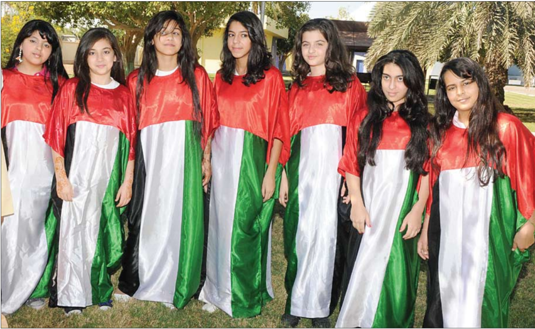
بالتزامن مع احتفالات الدولة بالعيد الوطني