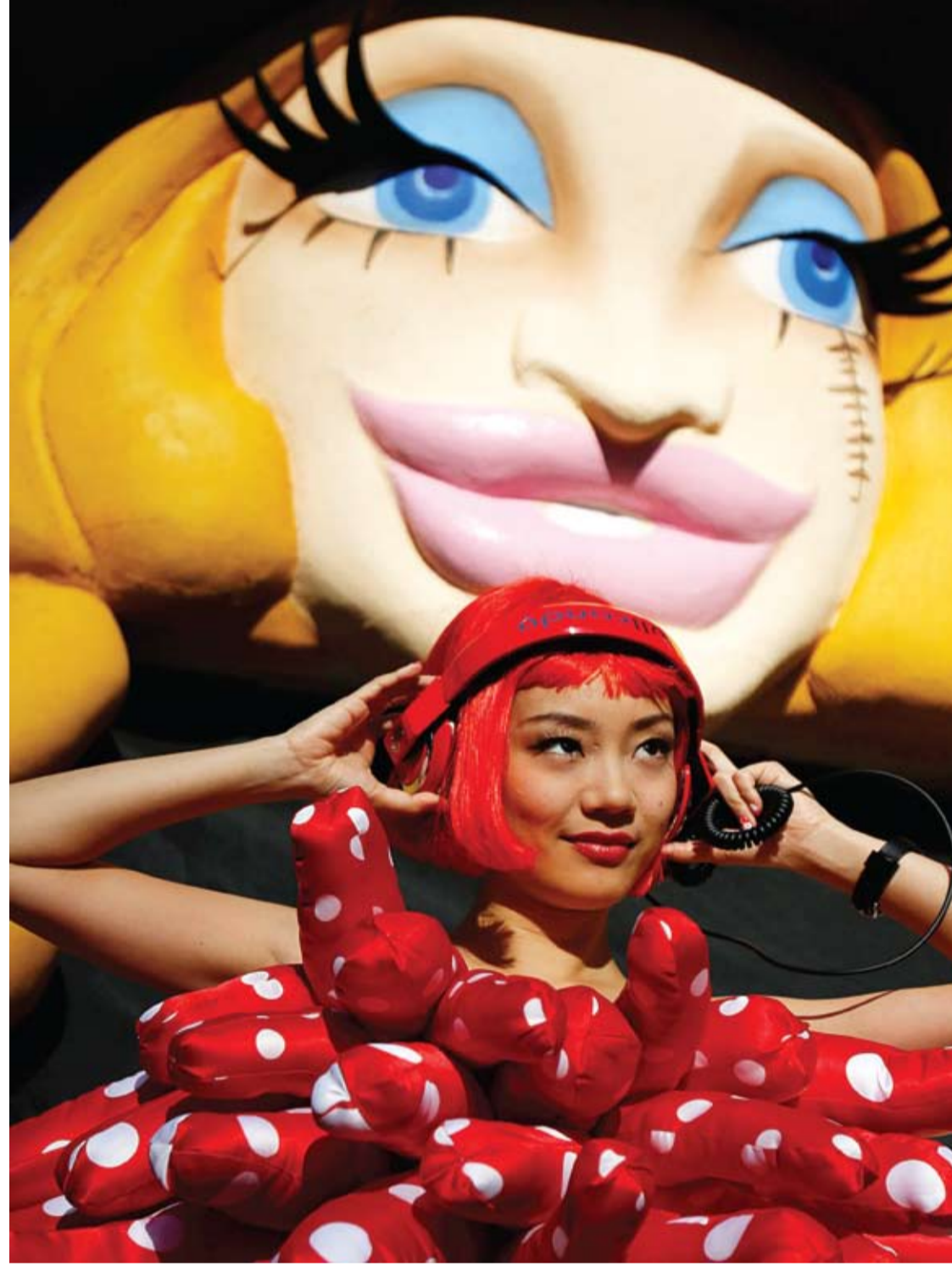
فتاة تردي زياً غريباً خلال مشاركتها في موكب هالوين في كاواساكي جنوب طوكيو.

ودفعت هذه النتائج المختصين إلى تقديم النصيحة للنساء المولعات بالتعرض لأشعة الشمس باستمرار بعدم تجاهل أهمية المستحضرات التي تحمي الجلد والبشرة من أضرار هذه الأشعة، إذ أنها تحد من وتيرة تهرل البشرة، بالإضافة إلى أنها وقاية من الإصابة بمرض سرطان الجلد.