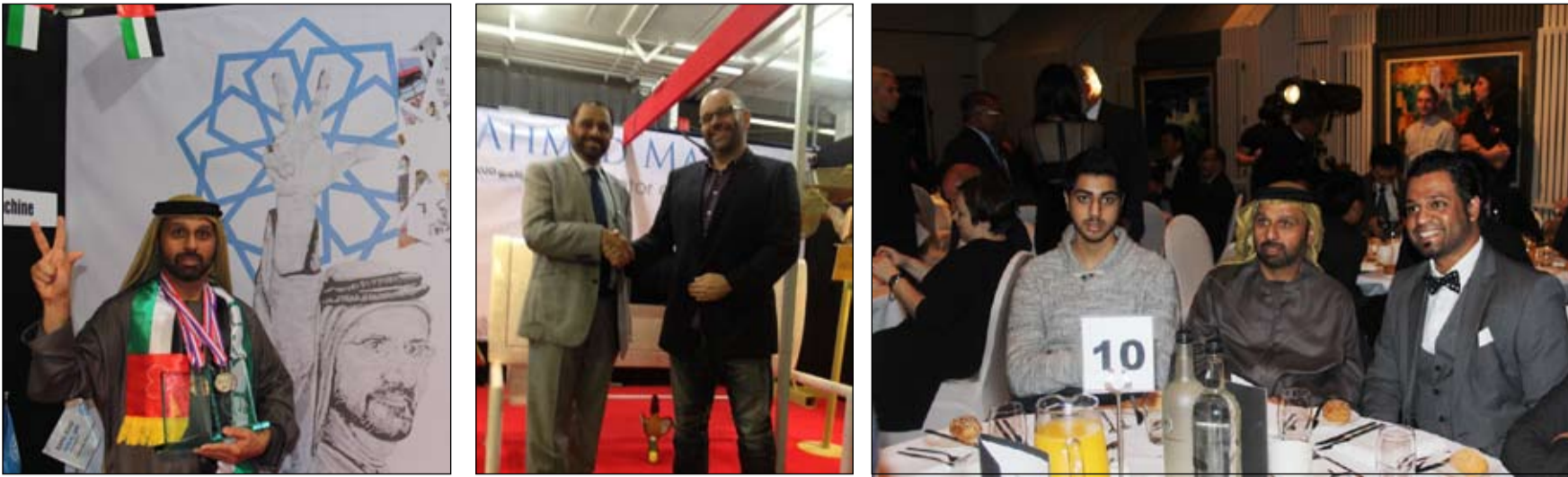
بحضور مكتب الملكية الفكرية البريطاني لبراءات الاختراع