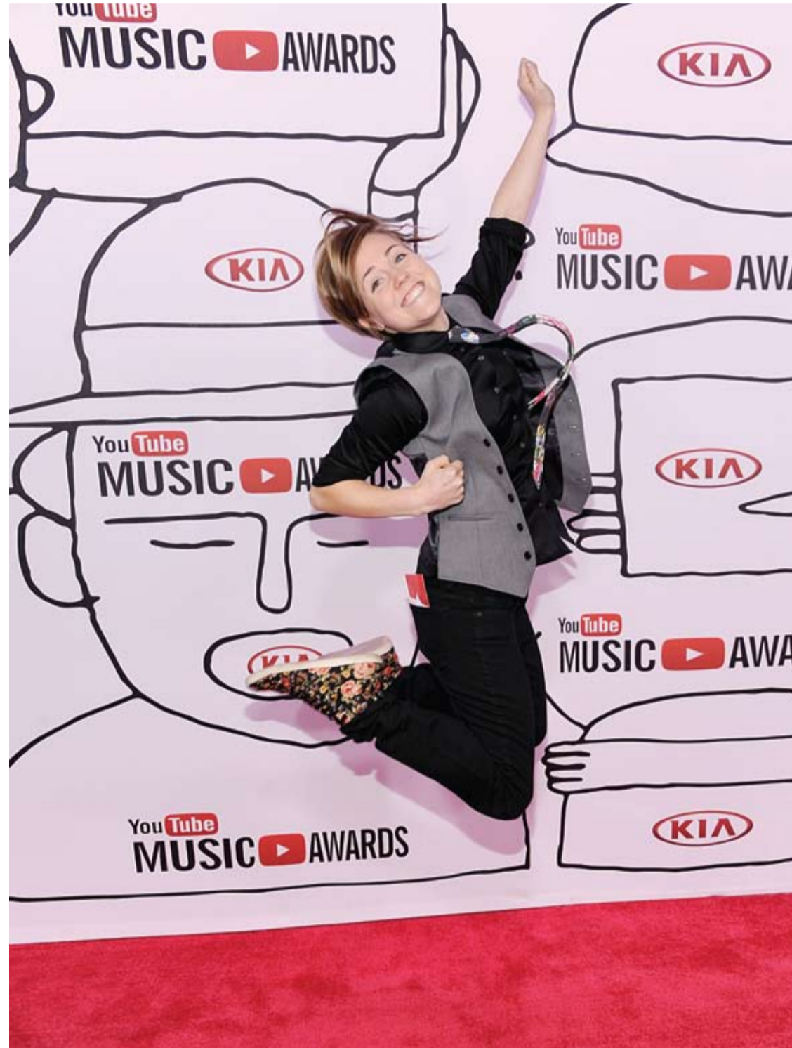
هانا هارت خلال حضورها جوائز يوتيوب الموسيقى 2013 في مدينة نيويورك. (أ ف ب)

وتقول إحدى الباحثات: حتى الآن لم نتعرف على الطريقة التي استطاع العسل من خلالها مقاومة البكتيريا، لكن على الأغلب أن مركباً داخل العسل اسمه methylglyoxal يتفاعل مع مركبات أخرى لم نعلمها حتى الآن، ليكون قادراً على تعطيل قدرة البكتيريا من إنتاج سلالات جديدة قادرة على مقاومة المضادات الحيوية.