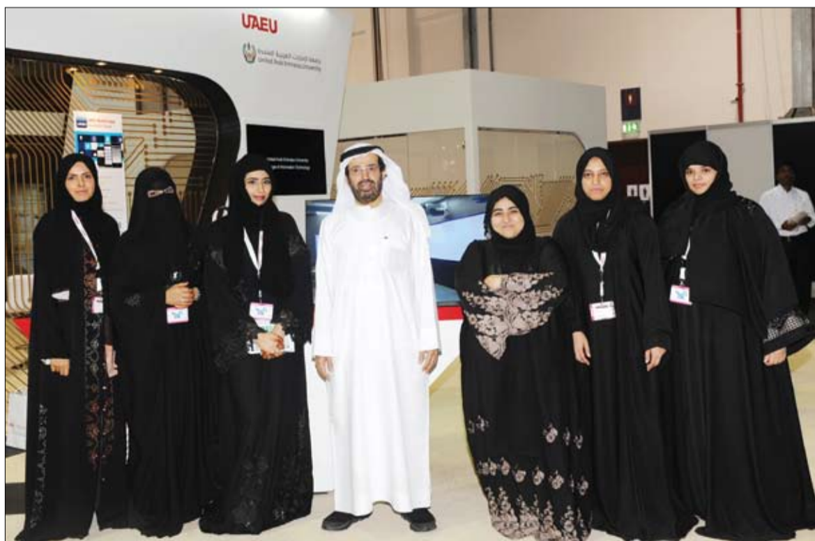
•• العين - الفجر:

حيث عرض الطلبة ما تم أنجازه من أرشفة للكتب ضمن المبادرة من خلال الأجهزة اللوحية الأيباد ضمن خطة تحويل مساقات الجامعة إلى مساقات إلكترونية. ويمكن للزائر لجناب جامعة الإمارات في معرض جيتكس أن يلاحظ الطلبة مع المشرفين وهم منشغلون بتحريك الروبوتات الذكية والطائرات التي تتحرك عن بعد في مشهد يدل على مدى التطور التقني بلغته جامعة الإمارات في هذا المجال.