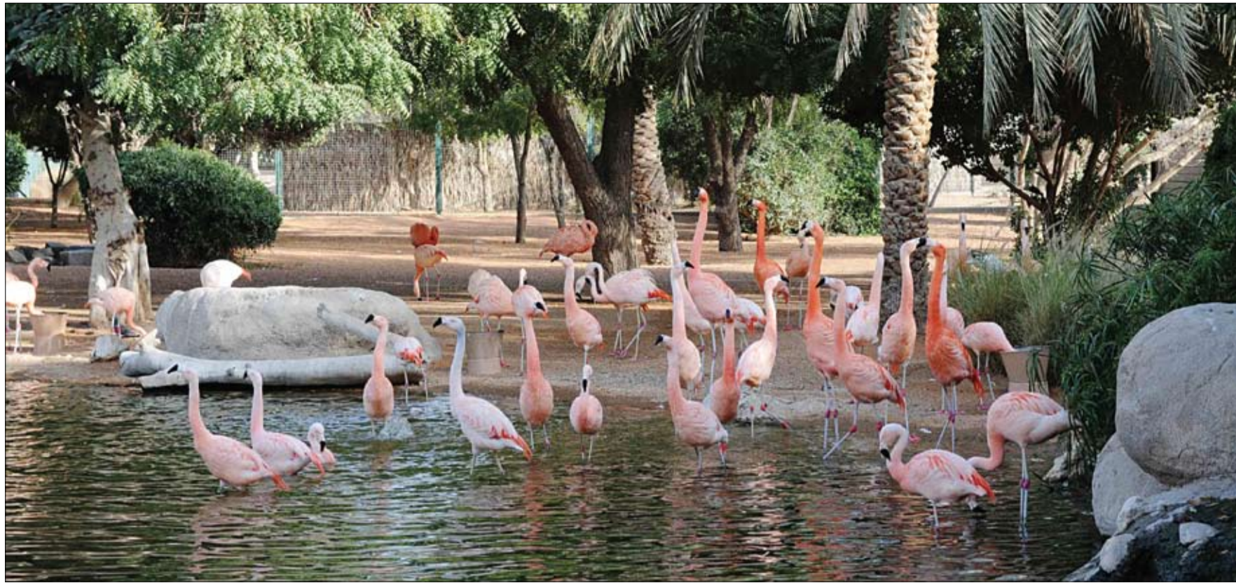
مرافق جديدة للتطوير والتحديث