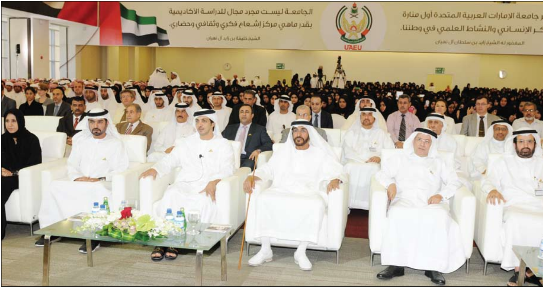
في لقاء ضم أكثر من ألفي طالب وطالبة من الجامعات الوطنية