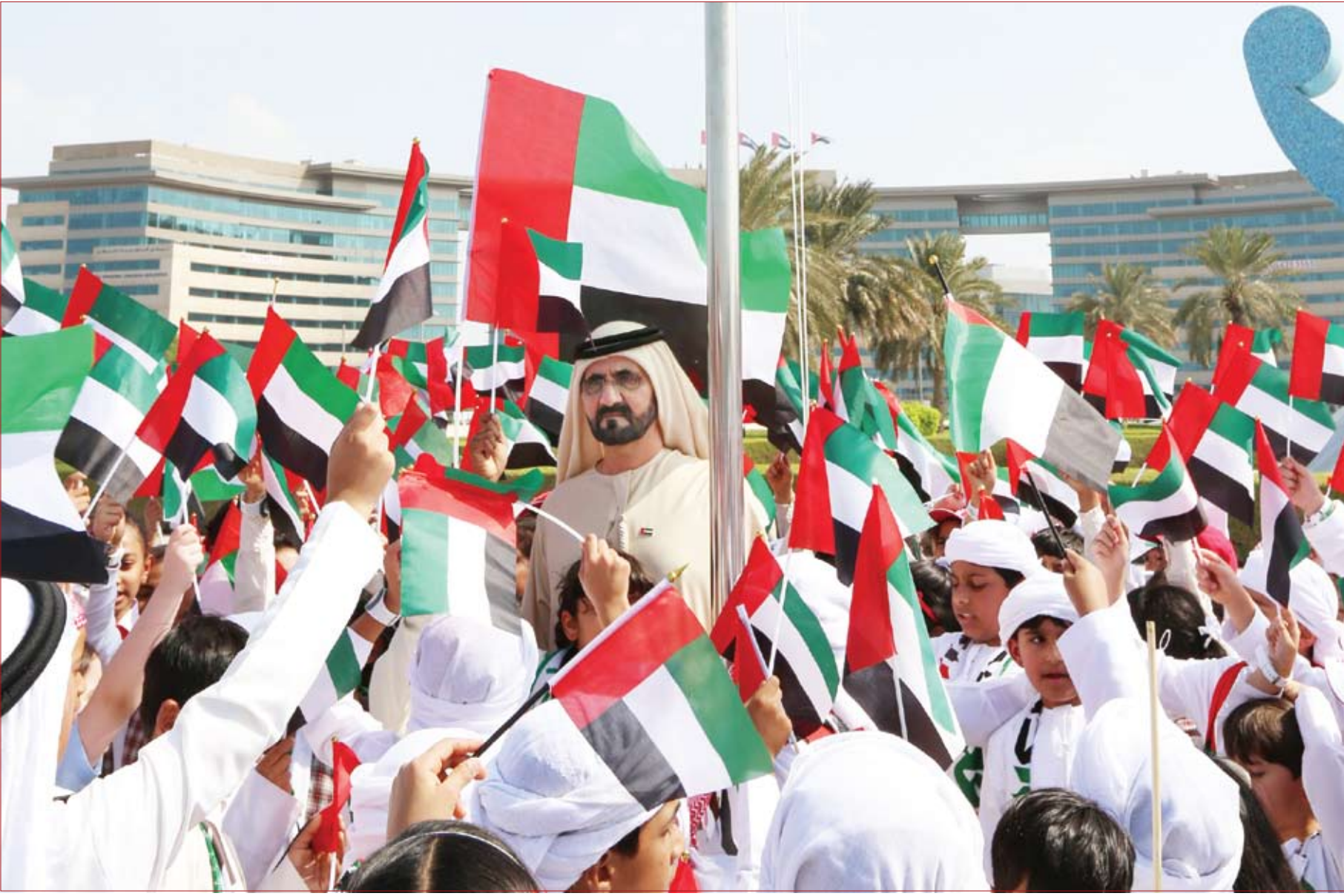
دام الأمان وعاش العلم يا إماراتنا

علم الامارات يوحد قلوب أبناء الوطن ويزيد انتماءهم قوة ورسوخا وشموخا